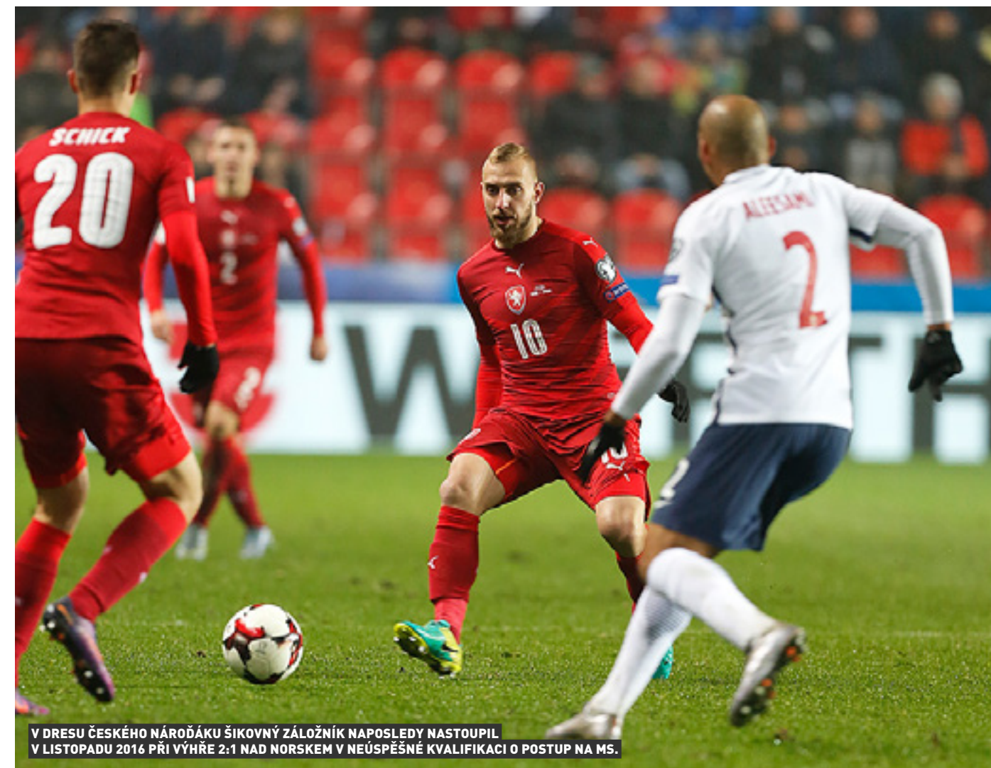
V DRESU ČESKÉHO NÁRODÁKU ŠIKOVNÝ ZÁLOŽNÍK NAPOSLEDY NASTOUPIL V LISTOPADU 2016 PŘI VÝHŘE 2:1 NAD NORSKEM V NEÚSPĚŠNÉ KVALIFIKACI O POSTUP NA MS.