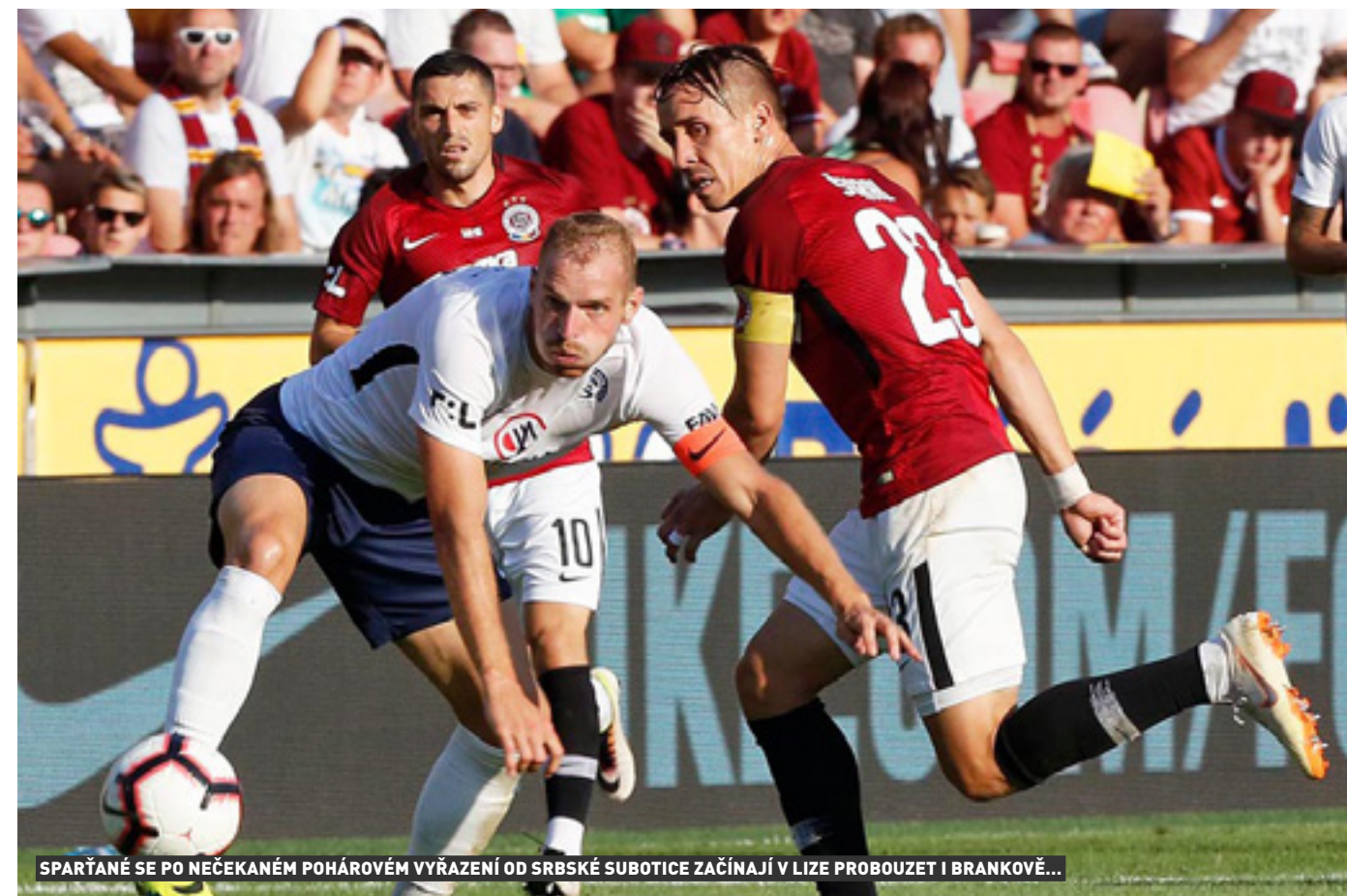
SPARTANÉ SE PO NEČEKANÉM POHÁROVÉM VYŘAZENÍ OD SRBSKÉ SUBOTICE ZAČÍNÁJÍ V LIZE PROBouZET I BRANKOVĚ...

Po teprve čtyřech odehraných ligových kolech lze sotva dělat nějaké závěry, byť dosavadní stoprocentní bodový zisk tří hned týmů (a zároveň největších favoritů na mistrovský titul Plzně, Slavie a Sparty), zaznamenaly tuzemské historické analýy naposledy v protektorátní lize... Uvidíme, jak jim tato bilance dlouho vydrží, každopádně určitě skončí před zářijovou reprezentační přestávkou, neboť v sedmém kole dojde v Edenu k prestižnímu souboji domácího vicemistra s úřadujícím mistrem!