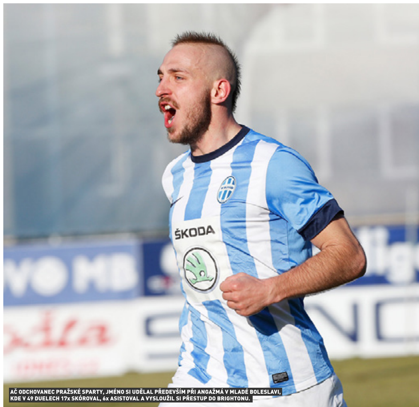
AC ODCHOVANEK PRAŽSKÉ SPARTY, JMÉNO SI UDĚLAL PŘEDEVŠÍM PŘI ANGAŽMÁ V MLADÉ BOLESLAVI, KDE V 49 DUELECH 17x SKÓROVAL, 6x ASISTOVAL A VYSLOUŽIL SI PŘESTUP DO BRIGHTONU.

„Mám asi na „Boro“ nějaký pech! Vedli jsme 2:0, mohli přidat ještě třetí nebo čtvrtý gól a bylo by hotovo. Jenže v posledních dvaceti minutách jsme se dostali pod velký tlak a Middlesbrough dokazoval, že znovu patří k hlavním aspirantům na postup do Premier League. Střídal jsem čtyři nebo pět minut před koncem a za chvilku hosté vstřelili kontaktní gól, po kterém to byla z naší strany ještě větší herní křeč. No a v šesté minutě nastavení jsme inkasovali vyrovnávací branku...”