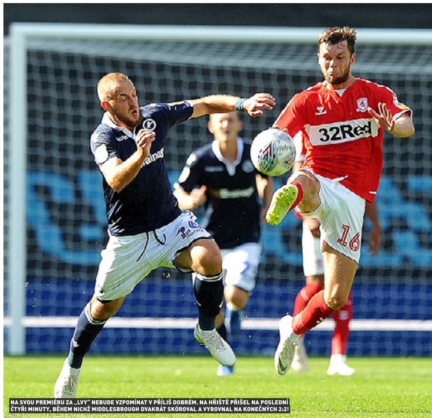
NA SVOU PREMIÉRU ZA „LVY“ NEBUDE VZPOMÍNAT V PŘÍLIŠ DOBRÉM. NA HRISTĚ PŘIŠEL NA POSLEDNÍ ČTYŘI MINUTY, BĚHEM NICHŽ MIDDLESBROUGH DVAKRÁT SKÓROVAL A VYROVNAL NA KONEČNÝCH 2:2!

„Nechtěl jsem zažít další sezonu v této roli, i když jsem měl smlouvu ještě na rok a v ní i opci na další. Ani klub se už kategoričtě nebránil mému přestupu jinam. Ale hodně dlouho se jednání