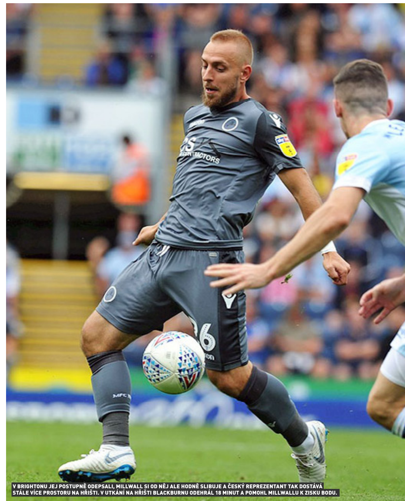
V BRIGHTONU JE J POSTUPNĚ ODEPSALI, MILLWALL SI OD NĚJ ALE HODNĚ SLIBUJE A ČESKÝ REPREZENTANT TAK DOSTÁVÁ STÁLE VÍCE PROSTORU NA HRŠTI. V UTKÁNÍ NA HRŠTI BLACKBURNU ODEHRÁL 18 MINUT A POMOHL MILLWALLU K ZISKU BODU.