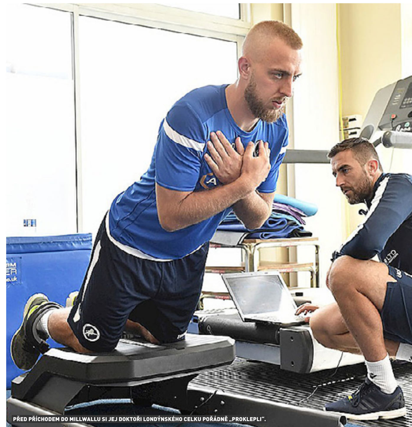
PŘED PŘÍCHODEM DO MILLWALLU SI JEJ DOKTOŘI LONDÝNSKÉHO CELKU POŘÁDNĚ „PROKLEPLI“.

táhla, protože Brighton, se kterým jsem normálně absolvoval letní přípravu, čekal s doplňováním hráčského kádru až po mistrovství světa v Rusku. Potom se teprve jednalo s potencionálními zájemci. Chtěl jsem každopádně zůstat v Anglii, pak jsem se musel ještě o domluvit i já. Millwall o mě dlouhodobě stál a jsem rád, že nakonec všechno klaplo.“