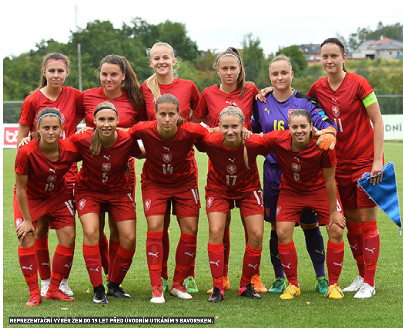
REPREZENTAČNÍ VÝBĚR ŽEN DO 19 LET PŘED ÚVODNÍM UTKÁNÍM S BAVORSKEM.