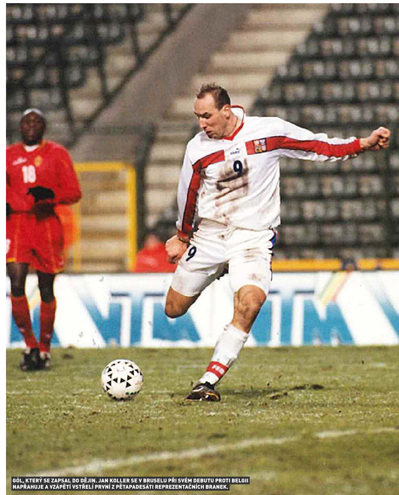
GÓL, KTERÝ SE ZAPSAL DO DĚJIN. JAN KOLLER SE V BRUSELU PŘI SVÉM DEBUTU PROTI BELGIÍ NAPRAHUJE A VZÁPĚTÍ VSTŘELÍ PRVNÍ Z PĚTAPADESÁTI REPREZENTAČNÍCH BRANEK.

► Třetího září v tréninkovém areálu hotelu nedaleko Vilnius si při nohejbalu s hráči reprezentačního výběru přetrhl achillovku Karel Brückner, asistent Jozefa Chovance a trenér jedenadvacítky. Kvalifikaci o den později sledoval v bolestech na lavičce, viděl po dvou brankách Nedvěda a Kollera a osmou výhru v kvalifikaci v řadě.