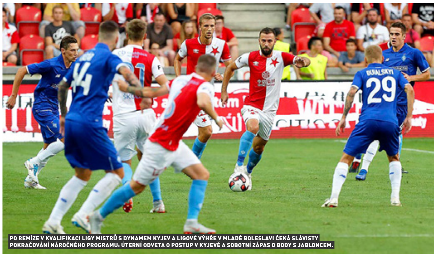
PO REMÍZE V KVALIFIKACI LIGY MISTRŮ S DYNAMEM KYJEV A LIGOVÉ VÝHŘE V MLADÉ BOLESLAVI ČEKÁ SLÁVISTY POKRAČOVÁNÍ NÁROČNÉHO PROGRAMU: ÚTERNÍ ODVETA O POSTUP V KYJEVĚ A SOBOTNÍ ZÁPAS O BODY S JABLONCEM.