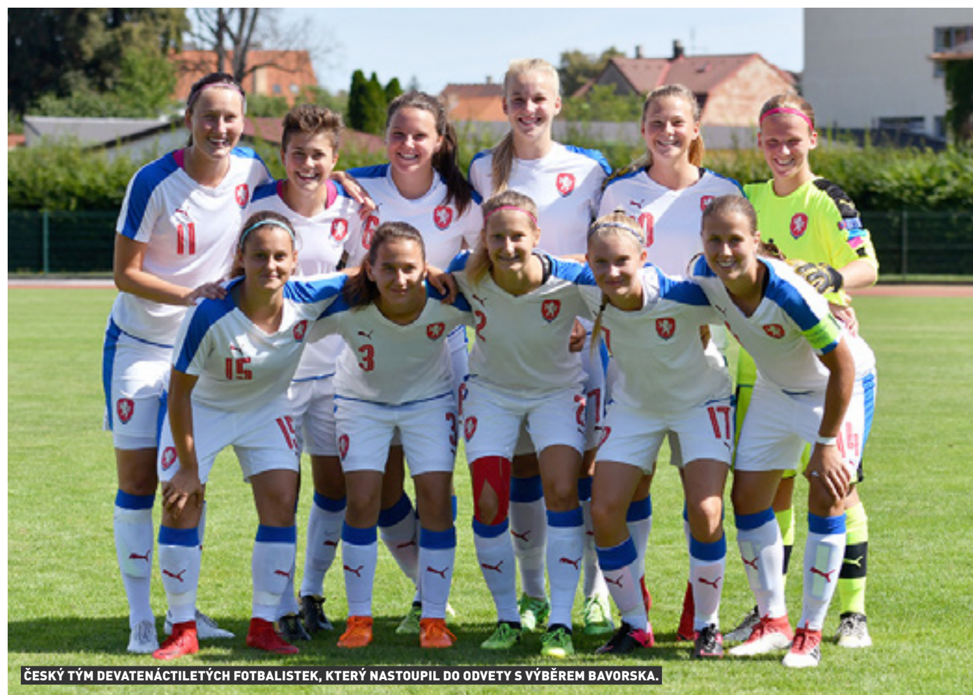
ČESKÝ TÝM DEVATENÁCTILETÝCH FOTBALISTEK, KTERÝ NASTOUPIL DO ODVETY S VÝBĚREM BAVORSKA.