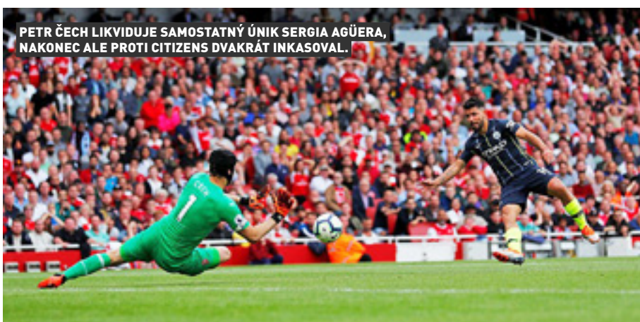
PETR ČECH LIKVIDUJE SAMOSTATNÝ ÚNIK SERGIA AGÜERA, NAKONEC ALE PROTI CITIZENS DVAKRÁT INKASOVAL.

V loňské sezoně deklasovali konkurenci, ligový titul ukořistili s obrovským náskokem devatenácti bodů na druhé rivaly z Manchesteru United. A fotbalisté Manchesteru City nyní ukázali, že jsou na obhajobu více než dobře nachystáni - před týdnem zdolali Chelsea 2:0 v bitvě o Community Shield a v prvním kole Premier League stejným poměrem hravě zvítězili na půdě Arsenalu.