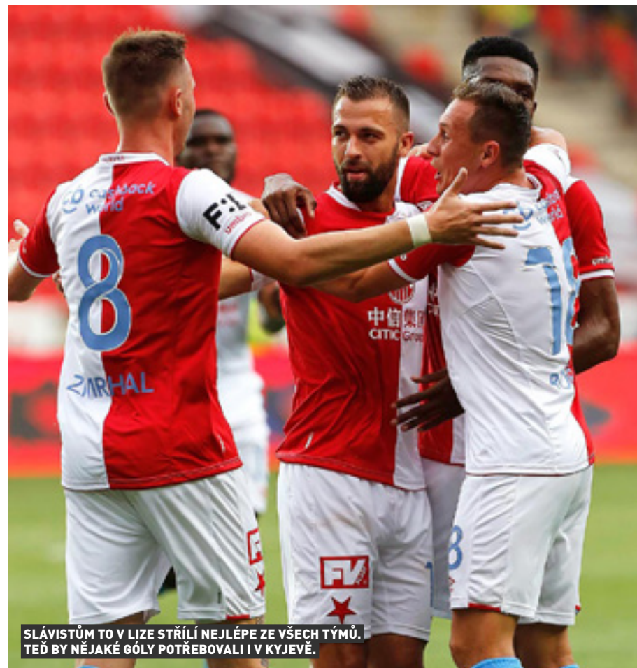
SLÁVISTŮM TO V LIZE STŘÍLÍ NEJLÉPE ZE VŠECH TÝMŮ. TEĎ BY NĚJAKÉ GÓLY POTŘEBOVALI I V KYJEVĚ.

Po teprve čtyřech odehraných ligových kolech lze sotva dělat nějaké závěry, byť dosavadní stoprocentní bodový zisk tří hned týmů (a zároveň největších favoritů na mistrovský titul Plzně, Slavie a Sparty), zaznamenaly tuzemské historické analýy naposledy v protektorátní lize... Uvidíme, jak jim tato bilance dlouho vydrží, každopádně určitě skončí před zářijovou reprezentační přestávkou, neboť v sedmém kole dojde v Edenu k prestižnímu souboji domácího vicemistra s úřadujícím mistrem!