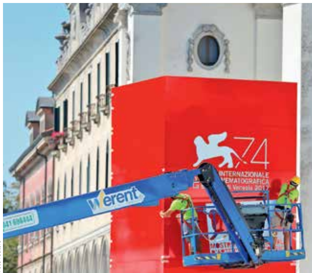
POSLEDNÍ PŘÍPRAVY. Technici dokončují slavnostní výzdobu festivalu, který začne dnes večer a skončí 9. září.

Přehlídka trvající do 9. září zároveň může zrodit první favority na Oscara – vždyť v posledních letech jej získaly za nejlepší film snímky Birdman, Spotlight nebo La La Land, které měly premiéru právě v Benátkách.