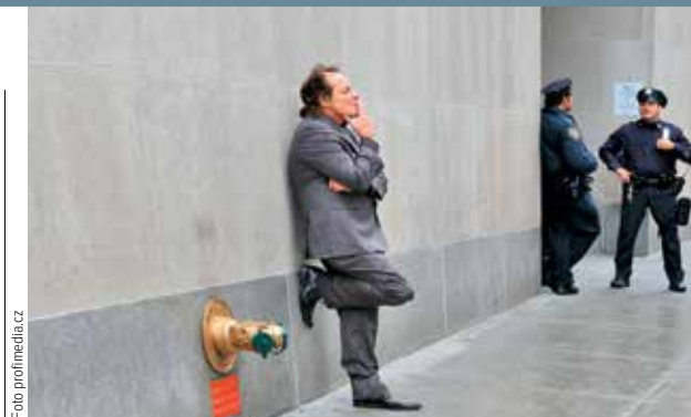
DRAHÁ ZÁLIBA. Z kouření v New Yorku se kvůli rostoucí ceně cigaret stává finančně náročný koníček.

Evropská měna poprvé od roku 2015 prolomila hranici 1,2 dolaru.