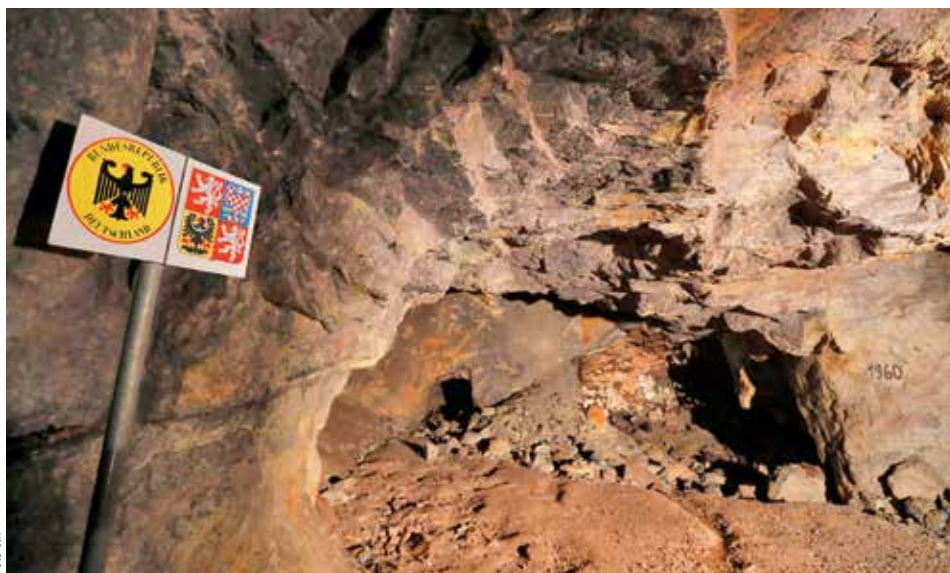
MEZNÍK. Bývalým dolem u obce Cínovec vede státní hranice. Dělí tak i podzemní ložiska lithia.

V Horním Slavkově je ovšem lithia více než dvojnásobek. Geologický průzkum zásoby vyčíslil na 5400 tun