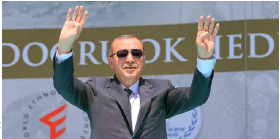
VMĚŠOVÁNÍ. Prezident Erdogan v posledních týdnech nabádá zhruba milion Turků žijících v Německu, jak mají hlasovat v tamních zářijových volbách.

Za akvizice a fúze v Latinské Americe utratili Číňané loni v meziročním srovnání více než dvojnásobek peněz – 12,4 miliardy dolarů. Téměř 60 procent čínských nákupů v posledních pěti letech přitom mířilo v tomto regionu právě do těžebního průmyslu.