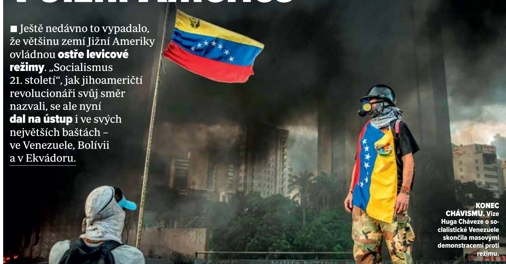
KONEC CHÁVISMU. Víze Huga Cháveze o socialistické Venezuele skončila masovými demonstracemi proti režimu.

■ Ještě nedávno to vypadalo, že většinu zemí Jižní Ameriky ovládnou ostře levicové režimy . „Socialismus 21. století“, jak jihoameričtí revolucionáři svůj směr nazvali, se ale nyní dal na ústup i ve svých největších baštách – ve Venezuele, Bolívii a v Ekvádoru.