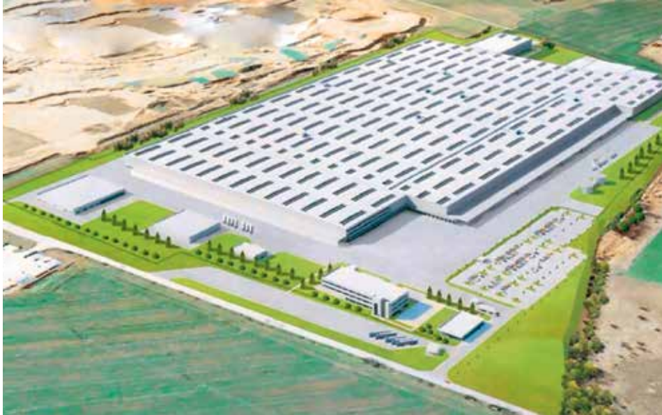
Vizualizace Amec Foster Wheeler

OBR. Kamiony v popředí vizualizace logistického centra Daimleru dávají tušit rozměry areálu. Odpovídají rozloze téměř tří Karlových náměstí v Praze.