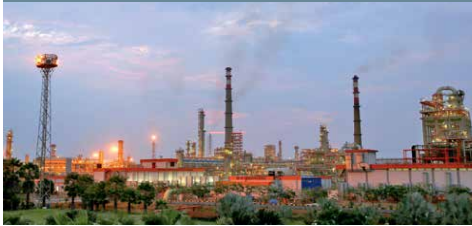
INDICKÁ AKVIZICE. Druhá největší soukromá rafinerie v indickém Vadínaru ve státě Gudžarát změní majitele a s ní 3500 indických čerpacích stanic Essar.