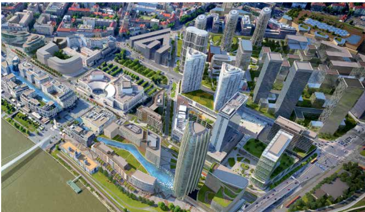
Visualizace: J&T Real Estate

Slovenské hlavní město se dosud rozvíjelo hlavně na levém břehu Dunaje. Výstavba to má ale změnit. Oba břehy mají být přitom spojené