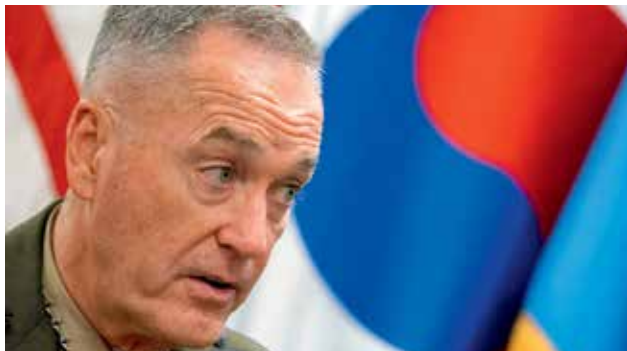
SCHŮZKA. Americký šéf sboru náčelníků štábů Joseph Dunford jednal s prezidentem Jižní Koreje Mun Če-inem.

Napětí mezi Pchjongjanem a Washingtonem se v posledních dnech zvýšilo kvůli obavám, že KLDŘ je schopná umístit jadernou hlavici do rakety, která může