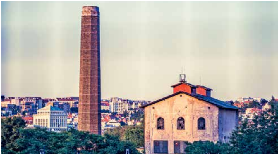
URČENO K PŘESTAVBĚ. Smíchovský či přesněji Zličovský lihovar získal svou dnešní podobu v roce 1907. Památkové ochrany se v areálu dostalo budově bývalé rafinerie lihu a polygonálnímu komínu.

Samotný vlastník zatím zůstává opatrný. „Dohoda o mlčenlivosti nám neumožňuje o věci mluvit podrobně-