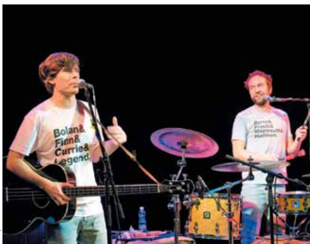
TATA BOJS. Součástí třiadvacátého ročníku Letní filmové školy bude i koncert pražských rockerů z Hanspaulky Tata Bojs.

Koncerty na škole zahájí v první den festivalu v Klubu Mír opavská kapela Děsně fajn a Sbor břežanských kastrátů. V dalších dnech pak na Masarykově