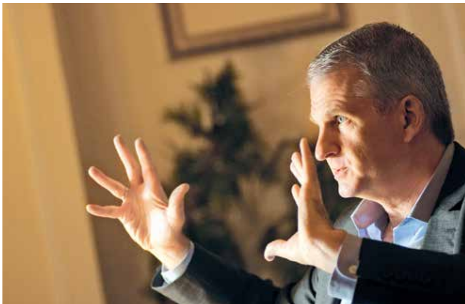
DVACET RAD. Filozof a spisovatel Timothy Snyder vystavěl svou novou knihu na dvaceti radách, jak se snažit zabránit nástupu další totality a tyranie ve Spojených státech i v Evropě včetně Česka.

Za ošepnými názvy kapitol ale stojí brilantní