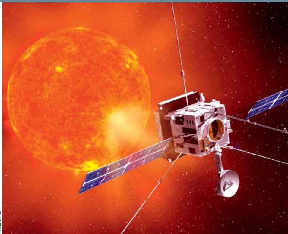
HORKÝ PRŮZKUM. Sonda Solar Orbiter dodá vědcům unikátní data o sluneční atmosféře. Pošle také snímky, na nichž budou vidět detaily s průměrem 180 kilometrů. Šířka slunečního disku přítom čini 1,4 milionu kilometrů.