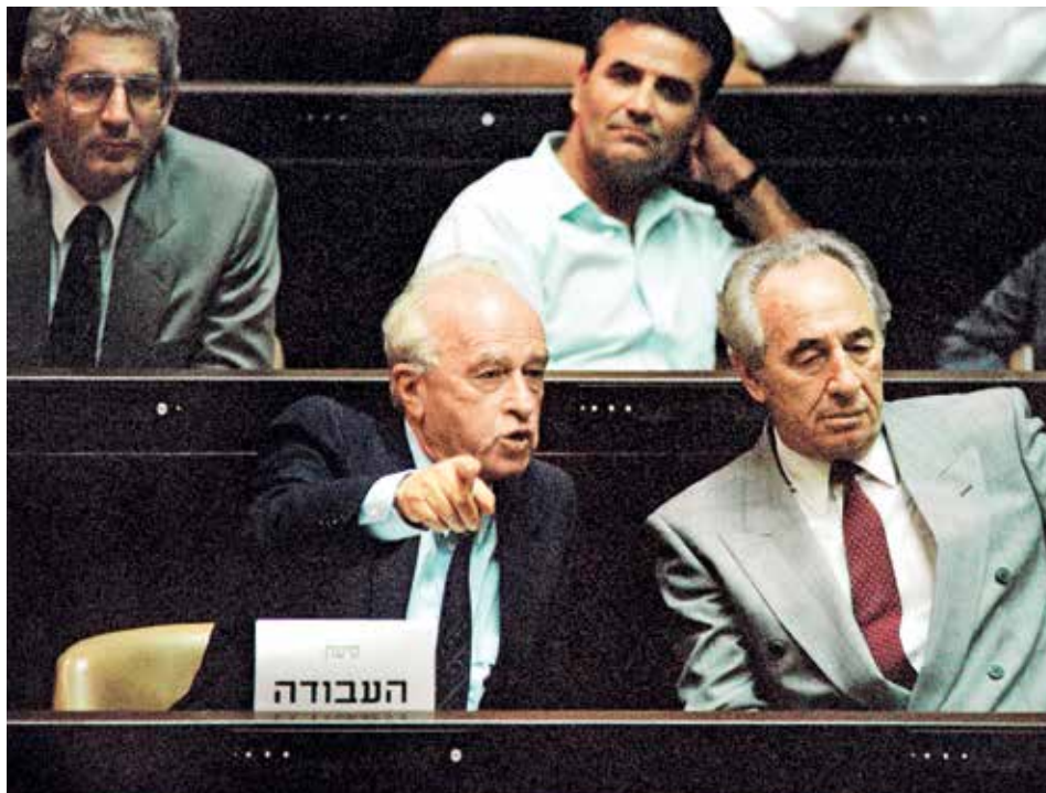
NESMÍRITELNÁ DVOJKA. Dvojnásobný izraelský premiér Jicchak Rabin (vlevo) sedící vedle svého tehdejšího ministra zahraničí Šimona Perese, který byl nejen dvakrát premiérem, ale jednou i prezidentem.

Washington je připraven Arafata v Bílém domě přijmout a to je pořádně komplikovaný manévr vzhledem k tomu, že OOP je podle