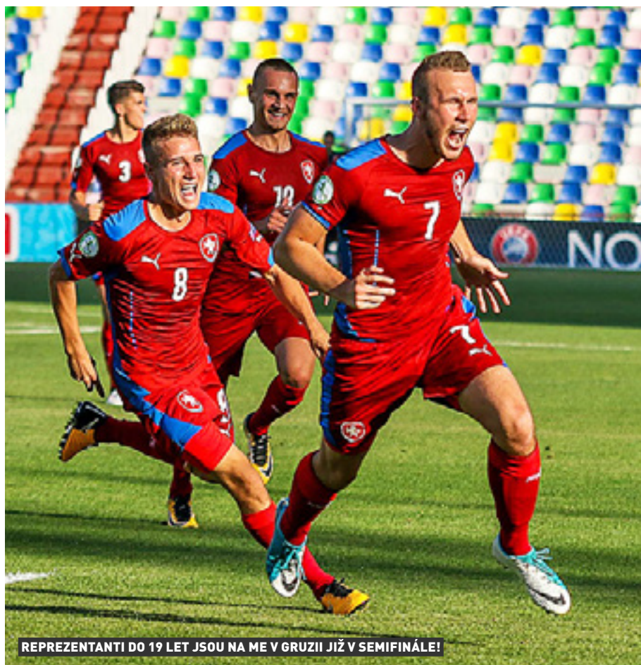
REPREZENTANTI DO 19 LET JSOU NA ME V GRUZII JIŽ V SEMIFINÁLE!

Pro český fotbal, který si před časem naplánoval masivní dlouhodobé investice do mládežnické základny, je semifinálový postup „devatenáctky“ na evropském šampionátu v Gruzii tou nejzářivější pochodní, že se vydal po správné cestě.