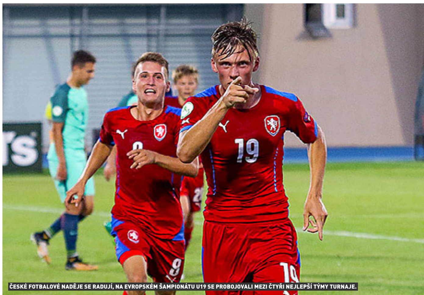
ČESKÉ FOTBALOVÉ NADĚJE SE RADUJÍ, NA EVROPSKÉM ŠAMPIONÁTU U19 SE PROBOJOVALI MEZI ČTYŘI NEJLEPŠÍ TÝMY TURNAJE.

Mladí čeští fotbalisté postoupili do semifinále mistrovství Evropy hráčů do 19 let. Svěřenci trenéra Jana Suchopárka v závěrečném utkání skupiny A porazili domácí Gruzii 2:0 a obsadili druhé místo za Portugalskem. Ve středečním semifinále je čeká vítěz skupiny B - silná Anglie!