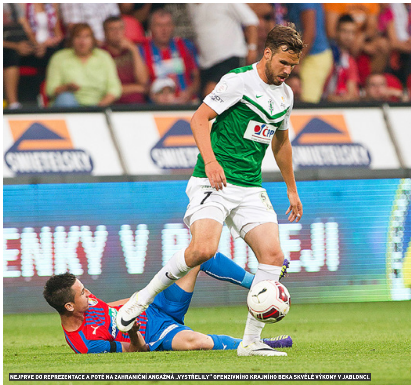
NEJPRVE DO REPREZENTACE A POTÉ NA ZAHRANIČNÍ ANGAŽMÁ „VYSTŘELILY“ OFENZIVNÍHO KRAJNÍHO BEKA SKVĚLÉ VÝKONY V JABLONCI.

„Díval jsem se na zápas v televizi, měl jsem tam v dánském týmu čtyři klubové spoluhráče, i když dva už tady nyní nejsou. Fandil jsem pochopitelně našim klukům, myslím si, že doplatili na dvě věci. Prohrávali většinu osobních soubojů, protože Dánové jsou ze zdejší ligy zvyklí na tvrdost, a taky spálili až moc vyložených příležitostí, proto jen neustále dotahovali náskok soupeře. Dánsku vývoj zápasu vyhovoval, mohli se soustředit především