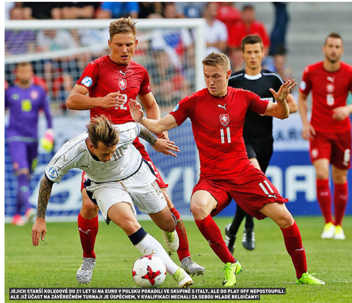
JEJICH STARŠÍ KOLEGOVÉ DO 21 LET SI NA EURO V POLSKU PORADILI VE SKUPINĚ S ITALY, ALE DO PLAY OFF NEPOSTOUPILI. ALE JIŽ ÚČAST NA ZÁVĚREČNÉM TURNAJI JE ÚSPĚCHEM, V KVALIFIKACI NECHALI ZA SEBOU MLADÉ BELGIČANY!

Pro český fotbal, který si před časem naplánoval masivní dlouhodobé investice do mládežnické základny, je semifinálový postup „devatenáctky“ na evropském šampionátu v Gruzii tou nejzářivější pochodní, že se vydal po správné cestě.