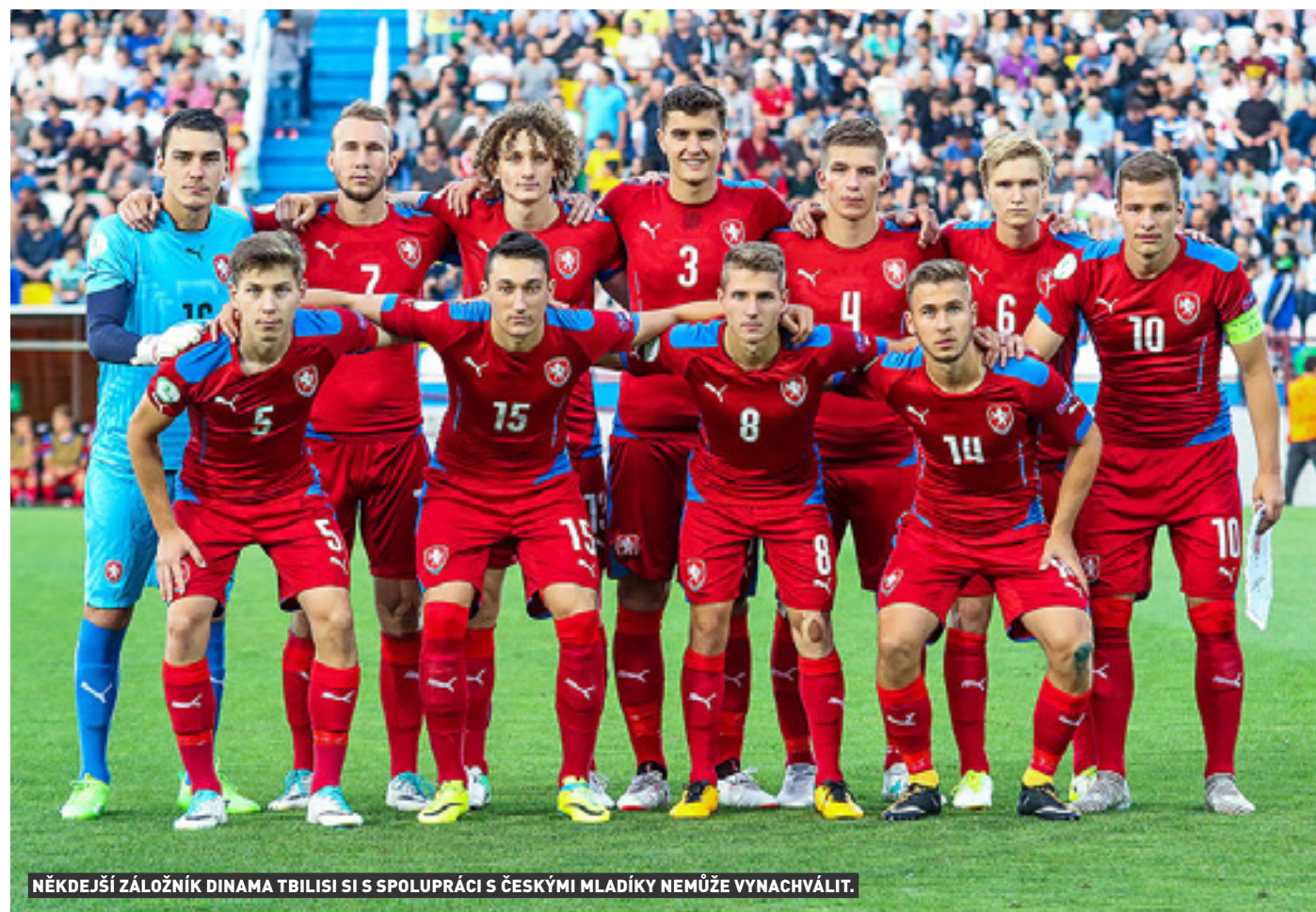
NĚKDEJŠÍ ZÁLOŽNÍK DINAMA TBILISI SI S SPOLUPRÁCI S ČESKÝMI MLADÍKY NEMŮŽE VYNACHVÁLIT.