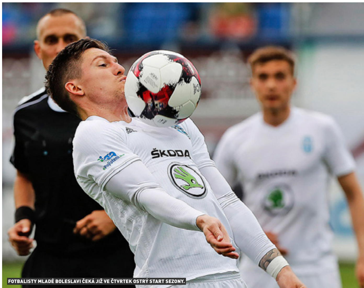
FOTBALISTY MLADÉ BOLESLAVI ČEKÁ JIŽ VE ČTVRTEK OSTRÝ START SEZONY.

Zatímco většina ligových mančaftů teprve ladí formu na soustředěních a v přátelských zápasech, fotbalisté Mladé Boleslavi už půjdou do ostré akce! Účastní se totiž bojů o pohárovou Evropu, jejichž úvodní fáze odstartovala již na konci června. Středočeši se nyní zapojí do 2. předkola Evropské ligy, jehož první duel je na programu ve čtvrtek 13. července.