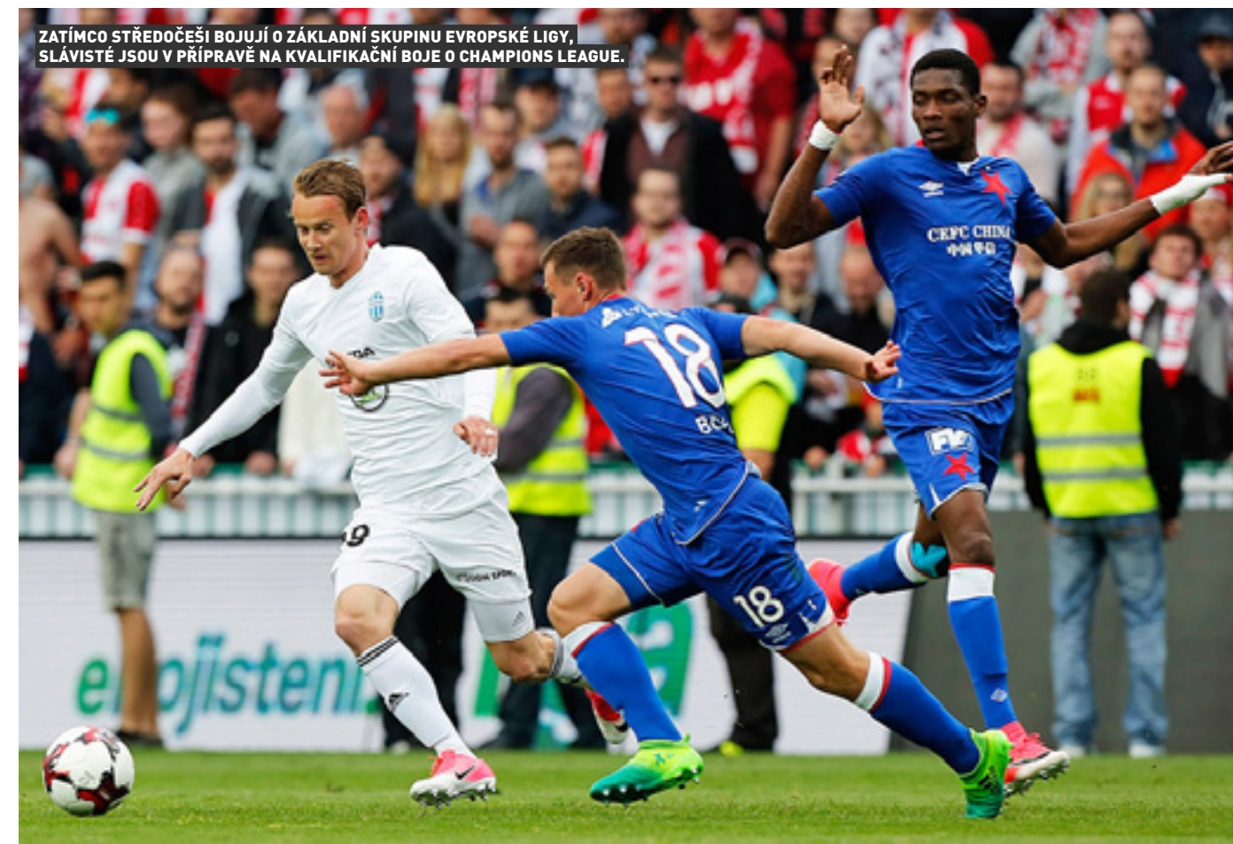
ZATÍMCO STŘEDOČEŠI BOJUJÍ O ZÁKLADNÍ SKUPINU EVROPSKÉ LIGY, SLÁVISTÉ JSOU V PŘÍPRAVĚ NA KVALIFIKAČNÍ BOJE O CHAMPIONS LEAGUE.

Zatímco většina ligových mančaftů teprve ladí formu na soustředěních a v přátelských zápasech, fotbalisté Mladé Boleslavi už půjdou do ostré akce! Účastní se totiž bojů o pohárovou Evropu, jejichž úvodní fáze odstartovala již na konci června. Středočeši se nyní zapojí do 2. předkola Evropské ligy, jehož první duel je na programu ve čtvrtek 13. července.