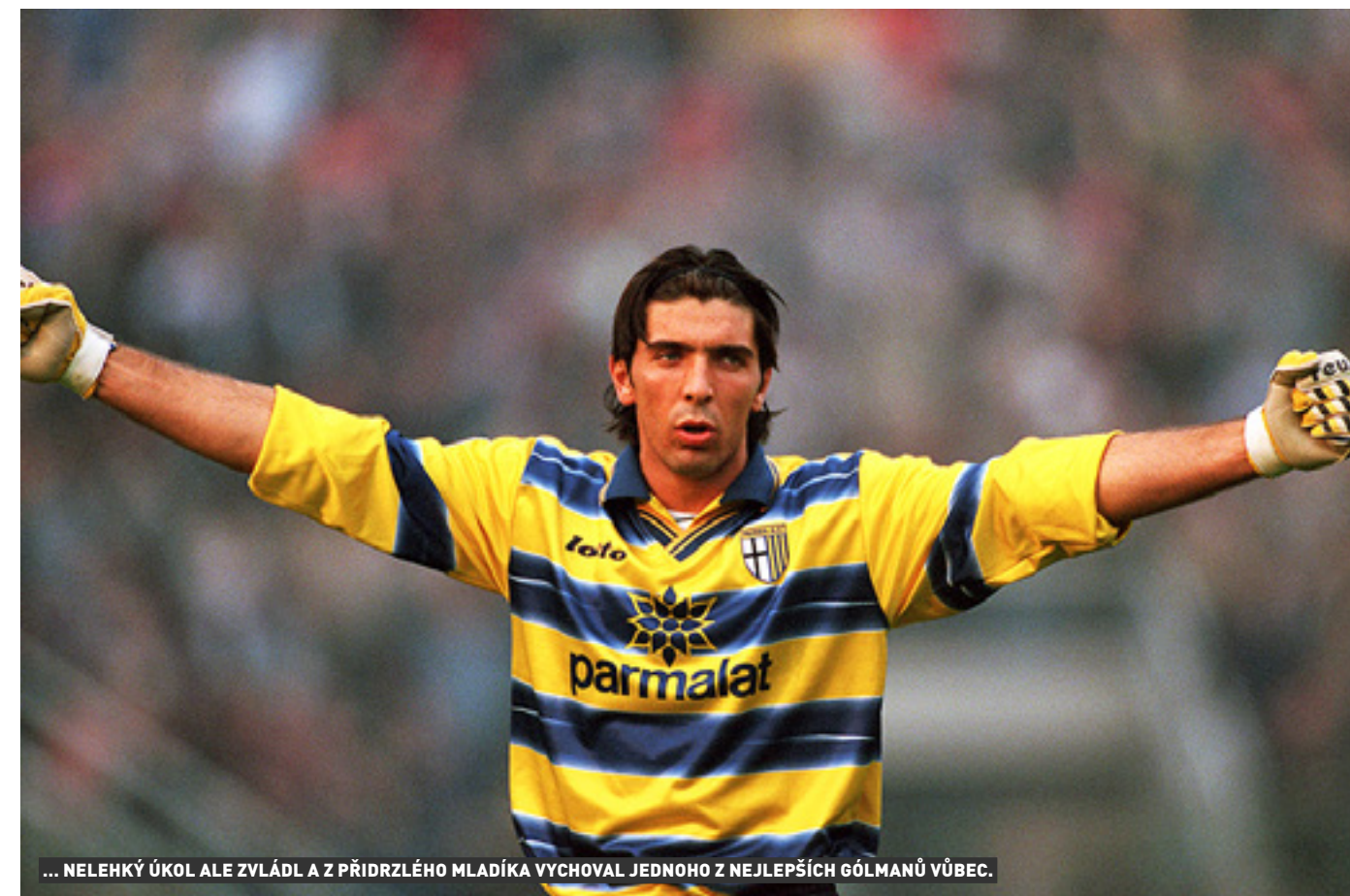
... NELEHKÝ ÚKOL ALE ZVLÁDL A Z PŘIDRŽELÉHO MLADÍKA VYCHOVAL JEDNOHO Z NEJLEPŠÍCH GÓLMANŮ VŮBEC.

Ten kluk autority nesnášel. Na mentorování a poučování byl přímo alergický. A ať mu ti starší cokoli řekli v dobrém či zlém, byl ještě vzpurnější.