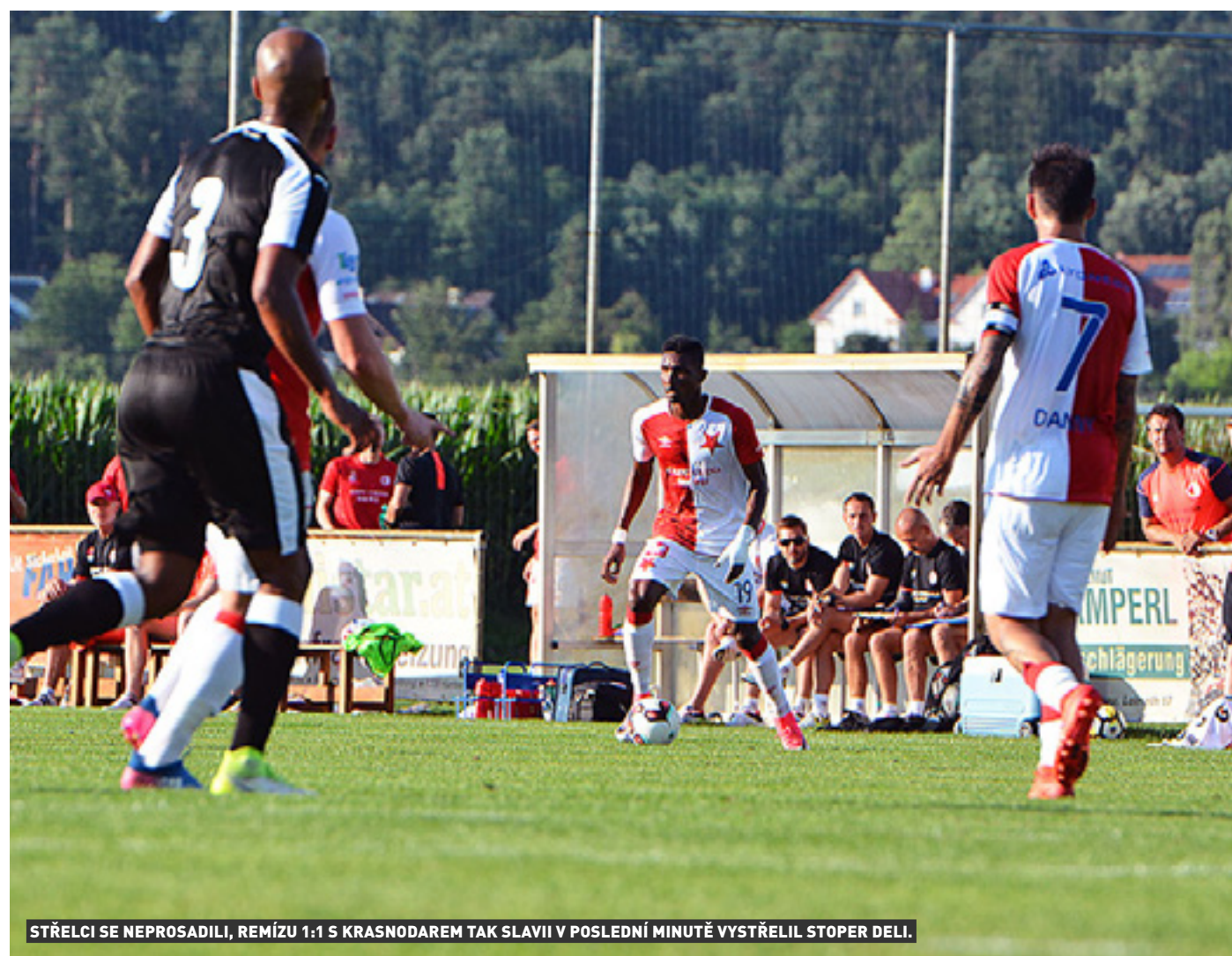
STŘELCI SE NEPROSADILI, REMÍZU 1:1 S KRASNODAREM TAK SLAVII V POSLEDNÍ MINUTĚ VYSTŘELIL STOPER DELI.