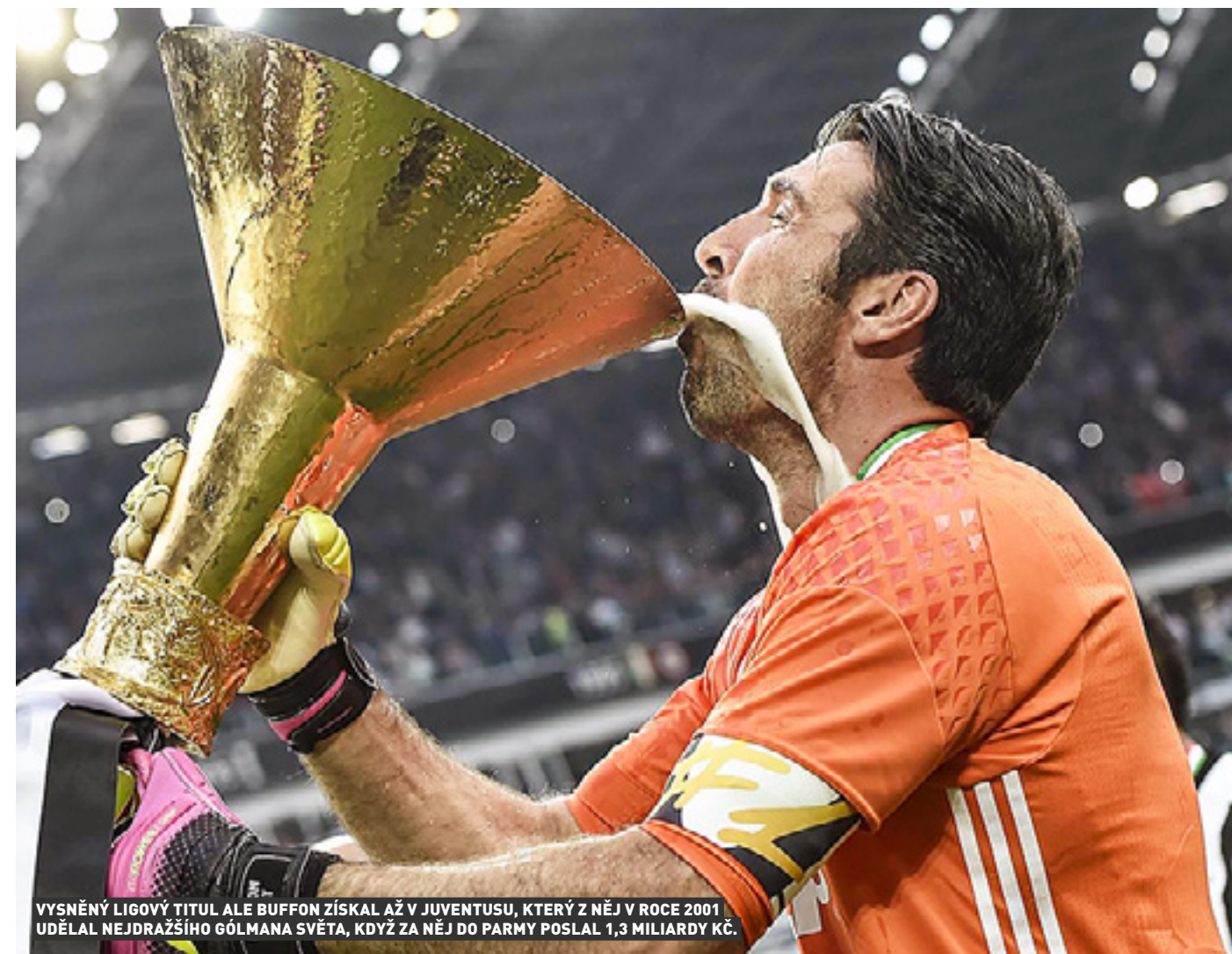
VYSNĚNÝ LIGOVÝ TITUL ALE BUFFON ZÍSKAL AŽ V JUVENTUSU, KTERÝ Z NĚJ V ROCE 2001 UDĚLAL NEJDRAŽŠÍHO GÓLMANA SVĚTA, KDYŽ ZA NĚJ DO PARMY POSLAL 1,3 MILIARDY KČ.

Prodavač ho o tom alespoň ujišťoval, ale o nějaké slevě nechtěl ani slyšet. A to do něho Gigi obden hučel, že jiným fotbalistům Parmensi už slevu dal. A na motorčky mnohem silnější a hlavně dražší.