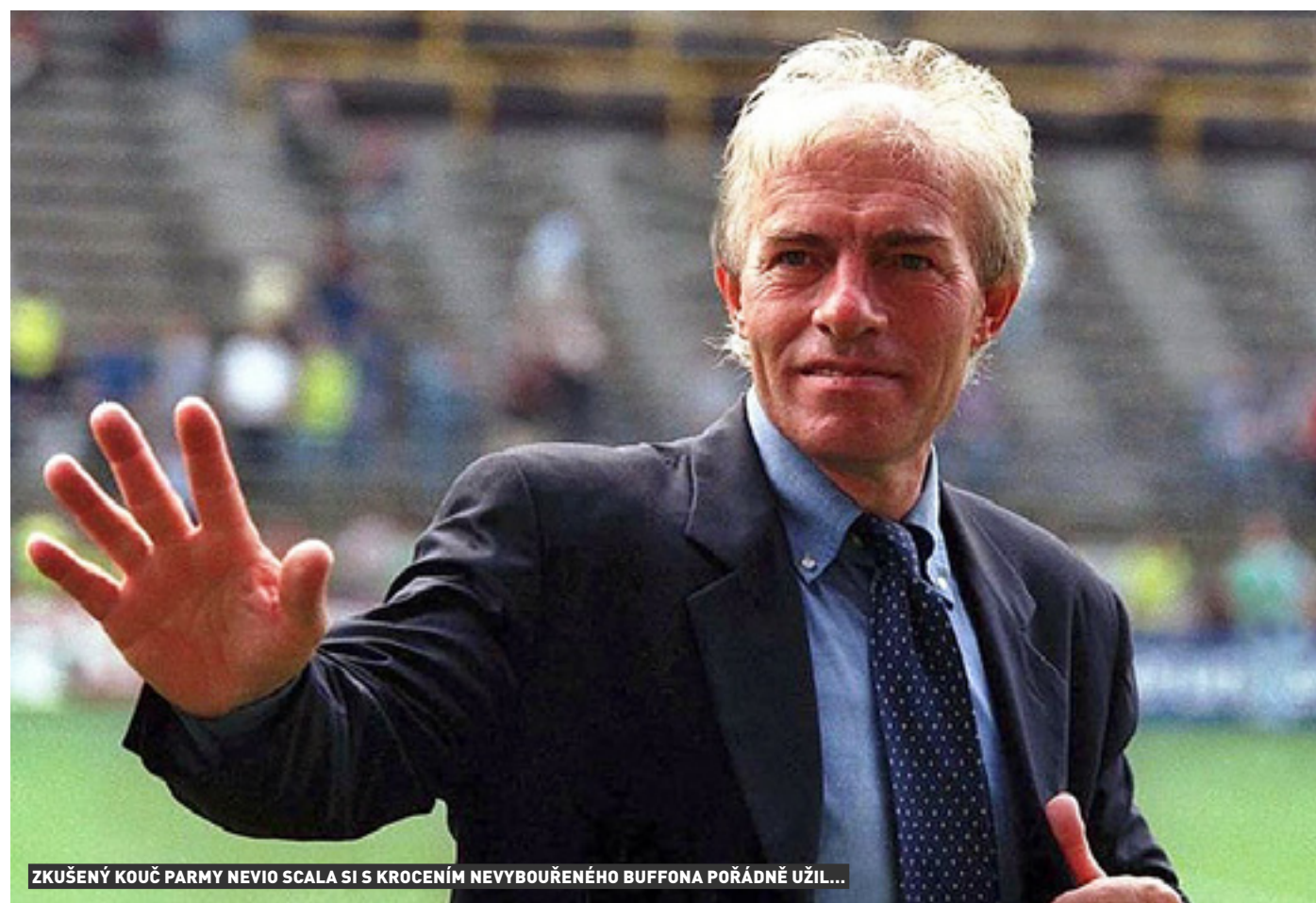
ZKUŠENÝ KOUČ PARMY NEVIO SCALA SI S KROCEM NEVYBOURENÉHO BUFFONA POŘÁDNĚ UŽIL...