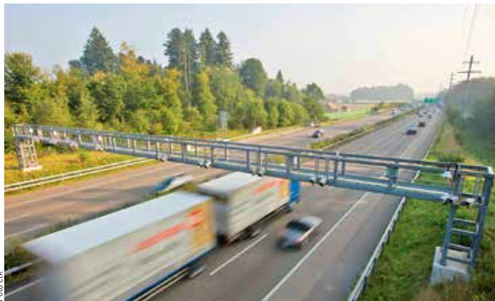
BOJ O MÝTO. V případě tendru na provozování mýtného systému jde o byznys za 27 miliard korun.