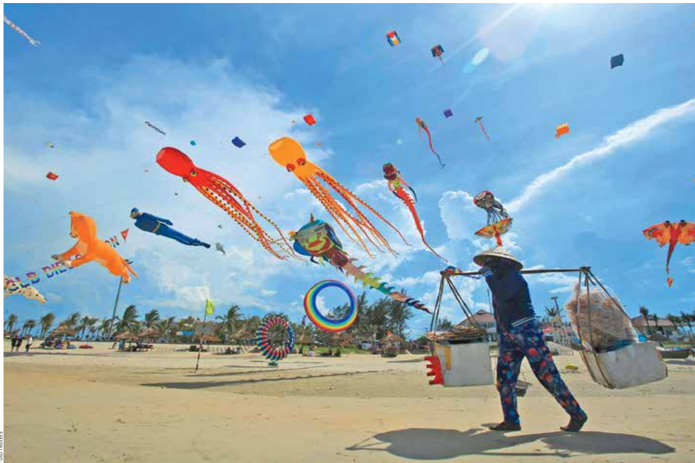
DRAČÍ FESTIVAL. Oblohu nad pláží Tam Thanh ve vietnamské provincii Quang Nam zaplnily stovky pestrobarevných dráků. Účastníci Mezinárodního festivalu dráků se dali inspirovat nejrozličnějšími živočichy a lidovou tvorbou ze dvou desítek zemí.