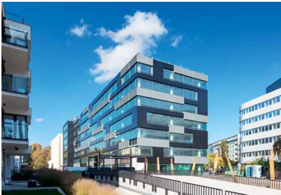
VÝSTAVBA NA PALMOVCE. V prostoru u jednoho ze slepých ramen Vltavy probíhá v současnosti intenzivní stavební činnost. Stavějí se zde jak bytové, tak i kancelářské budovy.

Dock je projekt, který celkově zahrne 120 tisíc metrů čtverečních bytů a kanceláří. Investice se