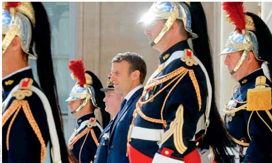
VZHŮRU DO DRUHÉHO KOLA. Hnutí prezidenta Macrona může v nadcházející neděli získat v druhém kole parlamentních voleb zdrcující převahu.

400 mandátů v 577členném Národním shromáždění.