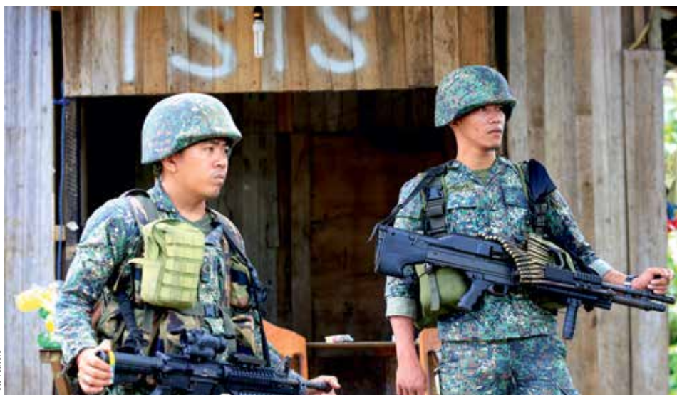
TVRDÉ STŘETNUTÍ. Vojáci hlídají před jednou ze skrýší sympatizantů s Islámským Státem v dobytém městě Marawi.

Nečekaným krokem chce filipínský prezident Rodrigo Duterte zvrátit síly v bojích s rebely na jihu země. Dvěma povstaleckým skupinám islamistů nabídl, že je včlení do filipínské armády. Zapojili by se tak do bojů proti jiné povstalecké organizaci Maute, s níž se v posledních dnech střetla filipínská armáda na ostrově Mindanao. Při nedělním projevu k armádě ve městě Cebu City prezident oznámil, že přijal nabídku na spolupráci od vůdce skupiny MNLF Nura Misuariho. Do filipínské armády tak mohou vstoupit dva až tři tisíce bojovníků z této organizace. K začlenění do vládních složek prezident vyzval také