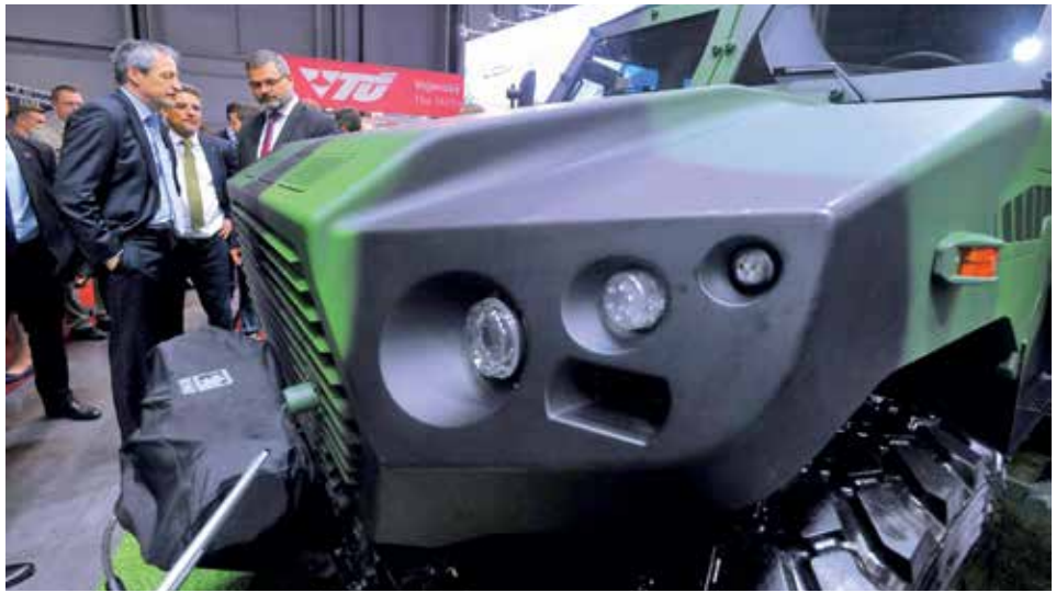
POMÁHÁME VÝVOZU. Ministr obrany Martin Stropnický vyzdvihl spolupráci české armády a zbrojářů, bez níž by se jim v zahraničí tolik nedařilo. Jeho úřad podle něj pomáhá i tak, že zve zástupce firem na cesty po světě. Letos se jich má uskutečnit 27.

Ministr obrany Martin Stropnický (ANO) považuje rostoucí čísla za pozitivní důsledek spolupráce jeho úřadu a armády se zbrojaři. Připomněl, že bez referencí domácích ozbrojených sil není o zbraně dané země v zahraničí zájem. „Za uplynulé