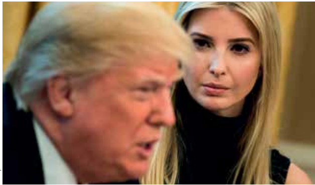
NESTANDARDNÍ SPOLUPRÁCE. Angažmá Světové banky v pomoci Ivance Trumpové i USA má podle všeho praktický důvod.

Trumpová je v současnosti jednou z hlavních tváří fondu, který si klade