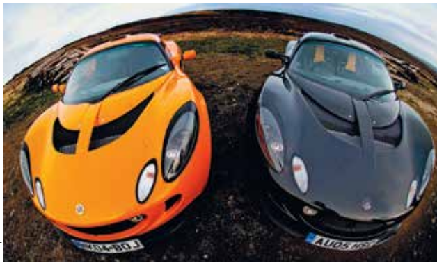
LEGENDÁRNÍ ZNAČKA. Čínské Geely se podařilo získat slavnou značku sportovních automobilů Lotus.

Tržní podíl Protonu, který ještě v devadesátých letech ovládal tři čtvrtiny malajsijského autotrhu, klesl na nyní nejvyšších 15 procent. Firma v poslední době převážně jen upravovala dovezená auta. Vláda loni značně poskytla pomoc ve výši 1,5 miliardy ringgitů (asi 8,25 miliardy korun). Podmínkou bylo, že vlastník Protonu – společnost DRB-Hicom – najde strategického investora. „Naše značka má teď šanci na comeback,“ řekl při ohlášení čínské investice malajsijský ministr financí Johari Abdul Ghani.