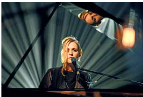
PO TŘECH LETECH se do Prahy vrací dánská pianistka a písničkářka Agnes Obel. Vystoupí v pátek večer v Akropoli.