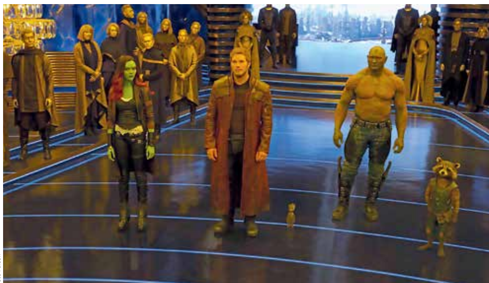
JINÍ SUPERHRDINOVÉ. Strážci Galaxie znovu ve filmové adaptaci marvelovského komiksu dokazují, že nejsou žádná tuctová parta.

Strážci Galaxie k tomu dokázali po mimořádném úspěchu prvního dílu v létě 2014 přijít s pokračováním, které jedničku ještě mírně předčí. Už jen tím, že díky postavě Baby Groota, jenž vyrostl z větvičky, zbytku po oběti velkého Groota na konci