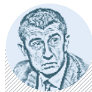
Andrej BABIŠ MINISTR FINANCÍ

Představení čísel rozpočtu na příští rok je spíše dobrým marketingovým tahem než reálným plánem, který bude odsouhlasen. str. 2