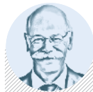
Dieter ZETSCHE ŘEDITEL DAIMLERU

Český správce pohledávek odkoupil od největší chorvatské banky balík problémových půjček v hodnotě přes patnáct miliard korun. str. 5