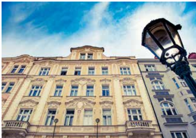
ČINŽÁK NA STARÉM MĚSTĚ. O luxusní byty v centru města je stále zájem.

„Po rekonstrukci chceme jednotky nabízet k dlouhodobým pronájmům náročné klientele, která ocení kvalitu podobně pojatého bydlení,