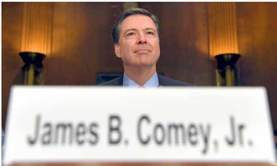
NEŽÁDOUCÍ VYŠETŘOVATEL. Comey podle Bílého domu nezvládl aféru e-mailů Hillary Clintonové. Podle kritiků Trumpa ale byl odvolán kvůli vyšetřování ruského vlivu na prezidentské volby.

„Jamese Comeyho nahradí ve vedení Federálního úřadu pro vyšetřování (FBI) někdo, kdo odvede daleko lepší práci a vrátí úřadu bývalého ducha a prestiž,“ reagoval