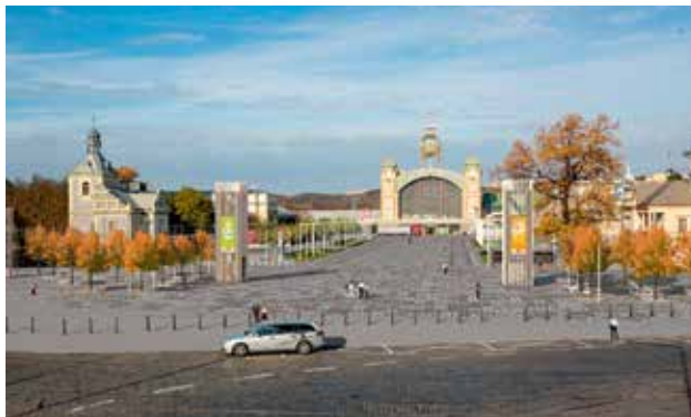
VSTUPNÍ PROSTOR SE ZMĚNÍ. Výstaviště se bude uzavírat jen v době, kdy zde budou placené akce.

Město nechá také upravit prostory před vstupem