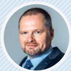
Petr Fiala (ODS)

Není důvod litovat pádu vlády Bohuslava Sobotky. Každý den, kdy nebude škodit této zemi, je dobrý. Jsme připraveni nabídnout občanům lepší alternativu.