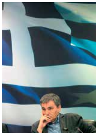
NUTNÁ DOHODA. Ministr financí Euklidis Tsakalotos dospěl k dohodě na poslední chvíli.

Dohoda zahrnuje reformy v oblasti práce a energie, ale také snížení penzí, a naopak