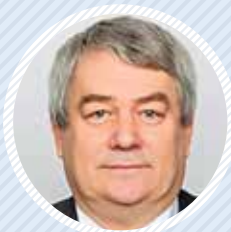
Vojtěch Filip (KSČM)

Je to (od Sobotky) vytvoření prostoru pro Andreje Babiše, aby ho donutil k rezignaci na post místopředsedy vlády a ministra financí. Do pátku tak asi budeme ještě svědky nějaké přestřelky.