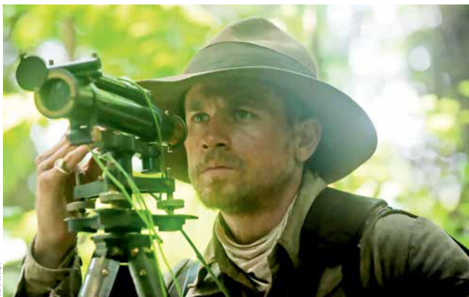
PRŮZKUMNÍK. Percy Fawcett v podání Charlieho Hunnama se vydal do džungle hledat jinou civilizaci.

Fawcett byl začátkem dvacátého století vyslán do Bolívie zmapovat tamní sporné hranice. Vrátil se pře-