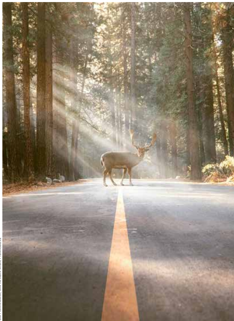
STŘET SE ZVĚŘÍ. Poškození vozidla díky střetu se zvěří je stále častější. Pojišťovny nabízejí na tuto nepříjemnou situaci připojištění.

Bonusy za bezeškolný průběh pojištění se sčítají, to znamená čím více měsíců bez nehody, tím větší sleva pro řidiče. Za každý rok může klient obvykle získat slevu