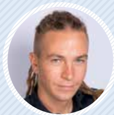
Ivan Bartoš (Piráti)

Je to předvolební tah socialistů. Když se jim koaliční spolupráce jeví jako nevhodná, přesvědčují voliče, že nesedí s ANO už čtvrtým rokem ve vládě.