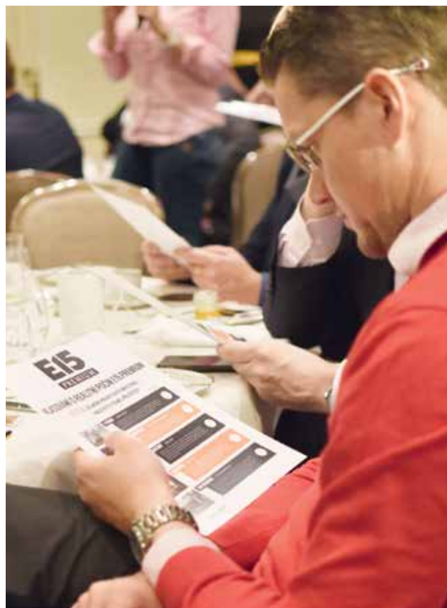
ANKETA. Redakce E15 Premium zúčastněným položila otázku: Do jakého nemovitostního projektu v Praze, který se nyní připravuje, byste investovali své prostředky?

Tématem příští diskuzní snižané a také magazínu E15 Premium bude energetika v nových podmínkách, dopady klimatických změn či budoucnost oboru.