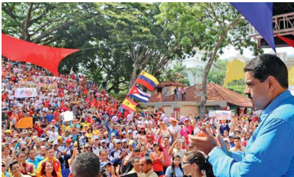
OSLOVÍ DAVY? Prezident Maduro se při četných mítincích snaží vylepšit image své vlády, zpravidla však neúspěšně.

Prezident v neděli nařídil zvýšit minimální mzdu o šedesát procent. Jen letos jde o třetí nárůst, od roku 2013 k tomuto kroku vláda přistoupila už patnáctkrát. Podle kurzu na černém trhu a po započtení dotací na jídlo tak bude příjem nejchudších vrstev odpovídat ani ne padesáti dolarům. Ceny potravin přitom rostou závratným tempem. Mezinárodní měnový fond očeká-