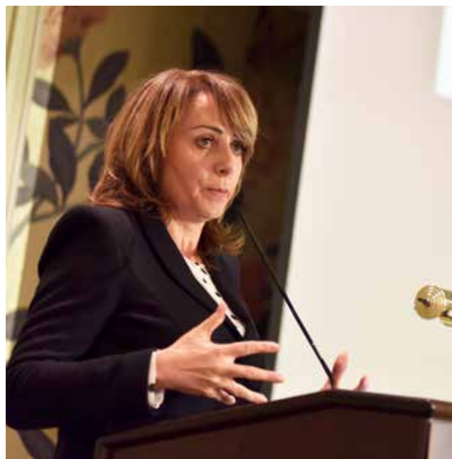
POHLED PRIMÁTORKY. Adriana Krnáčová se snažila developerům vysvětlit, proč je nemožné stávající komplikace na pražském realitním trhu řešit okamžitě.