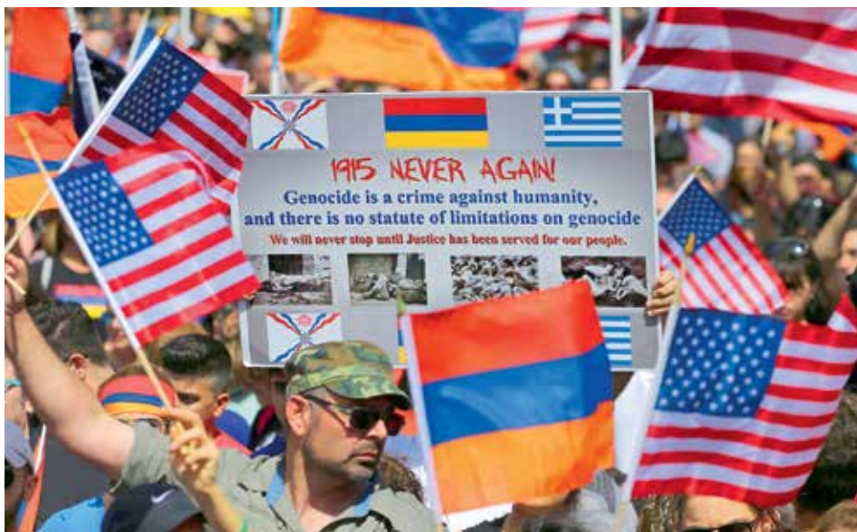
NEZAPOMENOU. Takhle to vypadalo, když demonstranti před tureckým konzulátem v kalifornském Los Angeles připomínali 102. výročí arménské genocidy v Osmanské říši.

Pro USA jsou důležité oba národy. Půlmilionová arménská komunita ve Spojených státech má velký vliv na byznys a pocházejí z ní významní podnikate-