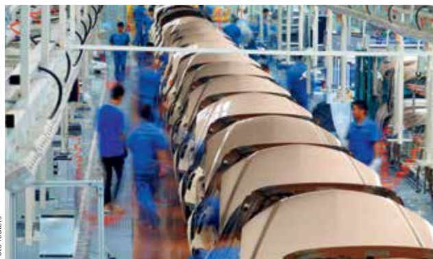
V PLNÉM PROUDU. Pracovníci společnosti Geely v továrně Cixi kompletují nové vozy.

Vleklá hospodářská krize a socialistické řízení venezuelské ekonomiky včetně případů znárodnování poškodilo řadu amerických a dalších zahraničních firem v zemi. Řada z nich své venezuelské aktivity přestala zahrnovat do svých standardních účetních bilancí. /čtk/