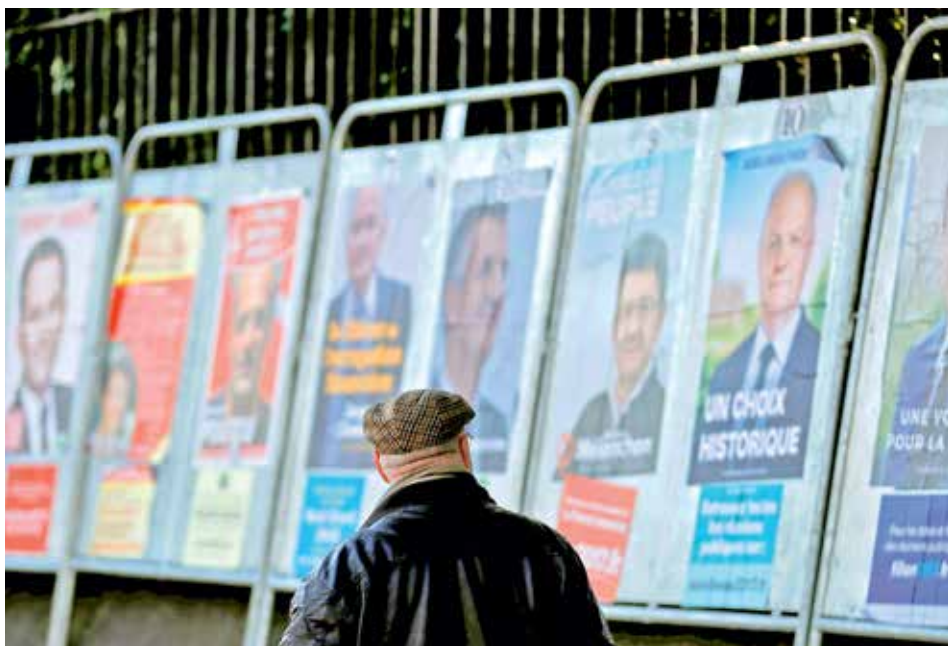
ŠIROKÝ VÝBĚR. Voliči ve Francii o víkendu rozhodnou o dvojici, která postoupí do druhého kola prezidentských voleb. Jasně však zatím nemají a situace je tak nestandardně nejasná.

Macron v posledních průzkumech vede nad Le Penovou zhruba o procento, jeho podpora dosahuje k 24 procentům. Fillon a Mélenchon se pohybují shodně kolem devatenácti procent. Na pátém místě je se značným odstupem socialista Benoît Hamon, v šetřeních nedosahuje