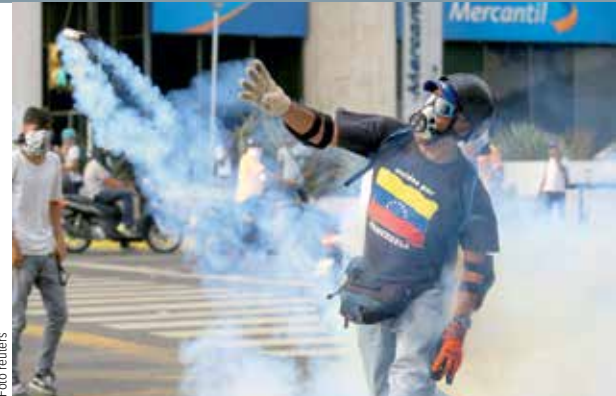
DEMONSTRACE. Opoziční aktivista policistům vrací slzný granát, který na něj vypálila při klidnění nepokojů v Caracasu.

V minulém roce se v Číně prodalo téměř 24 milionů vozů, z toho čínští výrobci v čele se značkami Wuling a Great Wall získali třiáctiprocetní podíl.