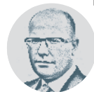
řekl o návrhu na zdanění korunových dluhopisů premiér Bohuslav Sobotka

Myslím, že ministr financí měl ten zákon předložit před třemi lety. Minulé tři roky zdaňování dluhopisů nebylo. Nevím, proč návrh předkládá až teď,