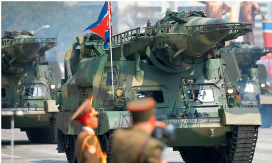
DEMONSTRACE SÍLY. Severokorejský režim o uplynulém víkendu uspořádal tradiční velkou vojenskou přehlídku ku příležitosti narozenin zakladatele KLDL Kim Ir-sena.

Když ale Severní Korea o tomto víkendu předved-