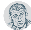
řekl ministr financí Andrej Babiš

Já už jsem dal v roce 2014 k posouzení, zda by s tím šlo něco dělat. Prý ne. Tak ať řeknou, proč to sami nezměnili už dříve. Svoji kritikou se chovají jako tradiční politici,