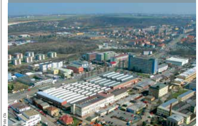
AREÁL ČEKÁ PROMĚNU. Území bývalé Tesly Hloubětín u Poďbradské ulice se změní v obytnou čtvrť.

Zákon o střetu zájmů prezídaný lex Babiš, který napadli prezident Miloš Zeman a poslanci hnutí ANO, vláda před Ústavním soudem hájit nebude. Ministr pro lidská práva a šéf legislativní rady vlády Jan Chvojka (ČSSD) včera oznámil, že proti vstupu do soudního řízení se postavili ministři ANO a KDU-ČSL. /čtk/