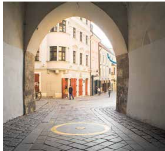
MICHALSKÁ BRÁNA. Lze vystoupit na její věž vysokou 51 metrů.