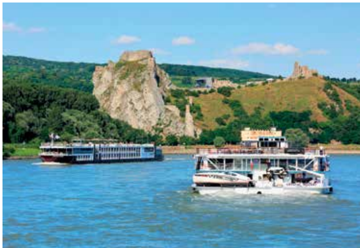
K SOUTOKU. Výletní lodě dovezou turistu až k místu, kde se vlévá do Dunaje řeka Morava.

Ať jde návštěvník centra Bratislavy kterýmkoli směrem, vždycky je v dosahu Dunaj. Velmi pěkný pohled je nejen z nábřeží na řeku, ale také z řeky na město. Klasická projížďka lodí zaveze turistu ke zřícenině hradu Děvín. Ten stojí nad skalou u soutoku, kde se vlévá do Dunaje řeka Morava. Děvín, který má historii už od devátého století, vyhodili o tisíc let později do povětří Napoleonovi vojáci. Dnes tu turisté z lodí vystoupí na prohlídku zříceniny, takže i s pauzou na oběd je plavba k Děvínu vlastně celodenní záležitostí.