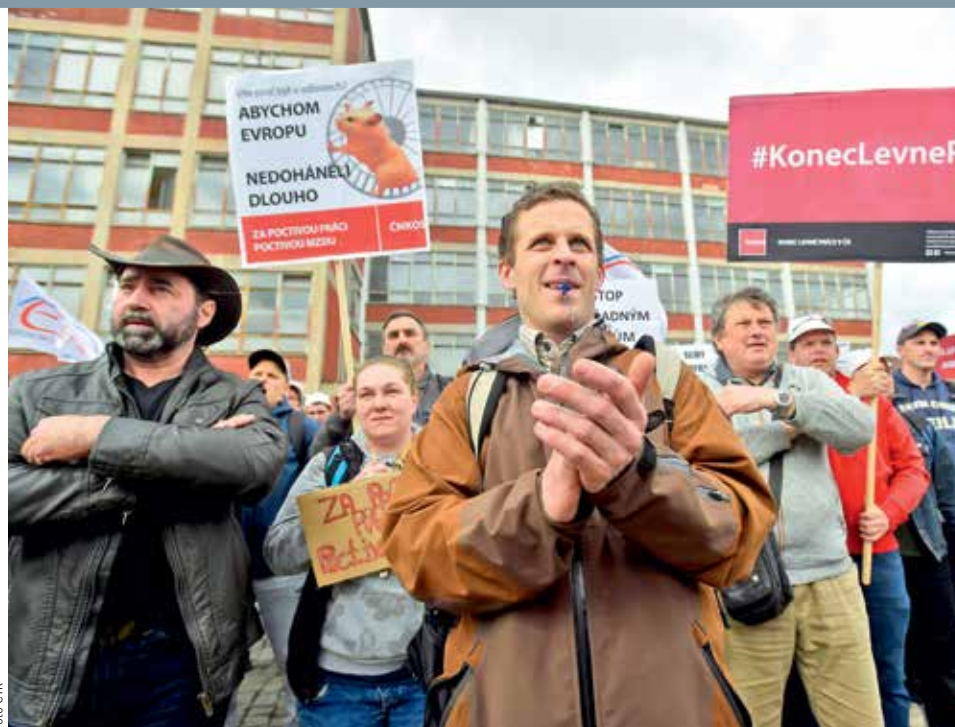
NEUSPOKOJENOST. Postavení zaměstnanců zlínského gumárenského závodu je v rámci oboru zoufalé, je přesvědčen předseda Českomoravské konfederace odborových svazů Josef Středula.