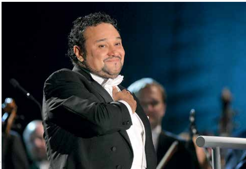
PODRUHÉ. Šestapadesátiletý uznávaný tenorista Ramón Vargas se letos v červenci představí na Mezinárodním hudebním festivalu Český Krumlov již podruhé. Poprvé se tak stalo v roce 2011.

Myslím, že Maria Callasová byla pro náš život a svět opery velmi důležitá, proto-