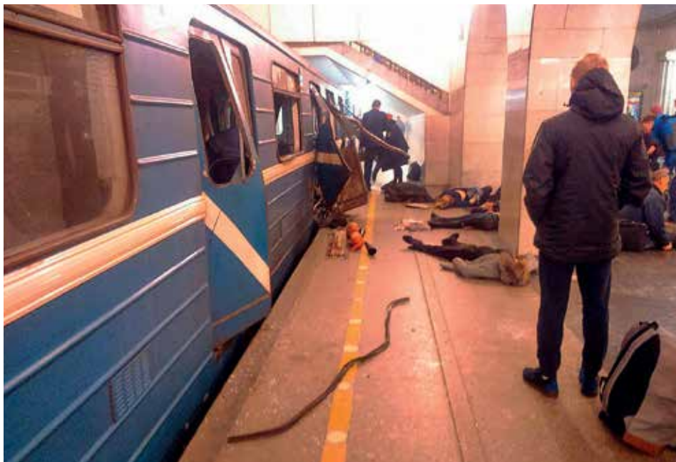
PUMOVÝ ÚTOK. Prezident Vladimir Putin nevyloučil, že útok souvisí s mezinárodním terorismem.

Podle televizní stanice Rossija 24 ještě před explozí byla jiná stanice metra uzavřena a evakuována kvůli výskytu podezřelého předmětu. Ruské úřady nepotvrdily, že by mezi oběťmi dnešní exploze byli turisté. Identita mrtvých ani zraněných ale do uzávěrky deníku E15 nebyla zveřejněna. Videokamery v prostorách metra