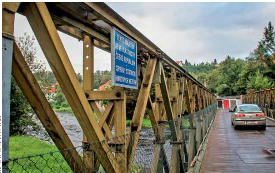
POVODŇOVÉ DĚDICTVÍ. První z konstrukcí ze státních skladů by mělo koupit město Český Krumlov, které jeden provizorní most využívá od povodní v roce 2002.

Cenu téměř padesátimetrového mostu stanovil znalec na osm milionů korun. Smlouva má být podepsána v polovině dubna. Z pohledu Státní správy hmotných rezerv je to přitom pouze první vlašťovka. Státní zásoby mostních konstrukcí totiž mají podle usnesení vlády projít výrazným omlazením, na což si chtějí správci