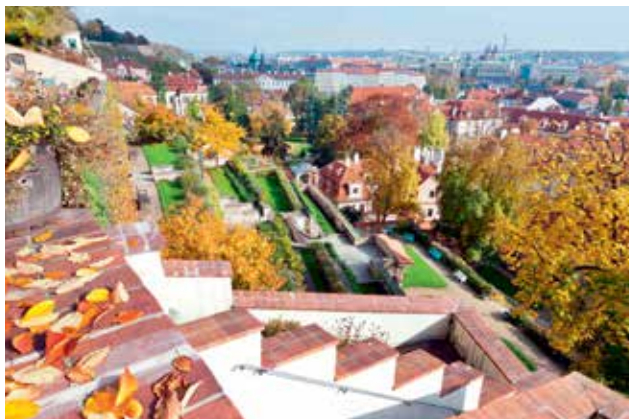
TURISTICKÉ LÁKADLO. Uzavření jednoho vchodu z bezpečnostních důvodů snížilo počet návštěvníků v zahradách pod Hradem.

Do zahrad bylo možné vstoupit z Jižních zahrad Pražského hradu přes zahradu Na Valech, což dnes už nelze, nebo z Valdštejnské ulice. Komplex teras pod Pražským hradem je jediným památkovým objektem NPÚ v hlavním městě. NPÚ je jedinou příspěvkovou organizací ministerstva kultury, která má výrazné vlastní zisky. Návštěvnost státních