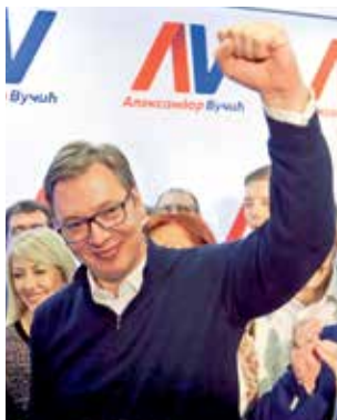
ZVOLEN V PRVNÍM KOLE. Aleksandar Vučić získal 55,13 procenta hlasů a stal se prezidentem Srbska.

Na druhém místě za Vučićem skončil bývalý ombudsman Saša Janković, jemuž svůj hlas dalo 16,3 procenta voličů. Třetí se s 9,4 procenta hlasů umístil komik a aktivista Luka Maksimović. Volební účast činila 55 procent,