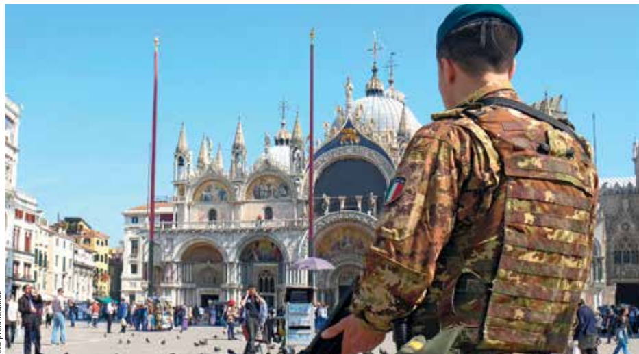
ITALSKÁ POLICIE rozbila islamistickou buňku, jejíž členové zvažovali teroristický útok na most Rialto v Benátkách. Policie skupinu sledovala od loňského roku. Jejím členům odposlouchávala telefony i byty a sledovala elektronickou komunikaci. Skupina vyjadřovala bezvýhradnou podporu Islámskému státu (IS) a oslavovala teroristický útok z Londýna z minulého týdne.