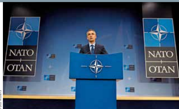
NOVÁ JEDNÁNÍ. Zástupci NATO a Ruska se snaží najít řešení konfliktu na Ukrajině a dodržet dohody z Minsku.

Izrael nyní vede pravicovou vládu, v níž je mnoho zastánců osad. Kabinet se chtěl původně opřít o novou administrativu ve Washingtonu, protože prezident Donald Trump uvedl, že mu nezáleží na tom, zda bude izraelsko-palestinský spor vyřešen jedním, nebo dvěma státy. Izrael z toho vyvodil, že Trump ustupuje od dosavadní americké politiky, která prosazovala vznik Palestiny vedle Izraele. /čtk/