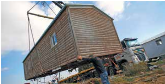
ZRUŠENÁ. Osadu Amona Izraelci museli rozebrat, neboť nevyhovovala ani jejich vlastním zákonům.

„Od začátku jsem slíbil, že vytvořím novou osadu. Zavázal jsem se k tomu