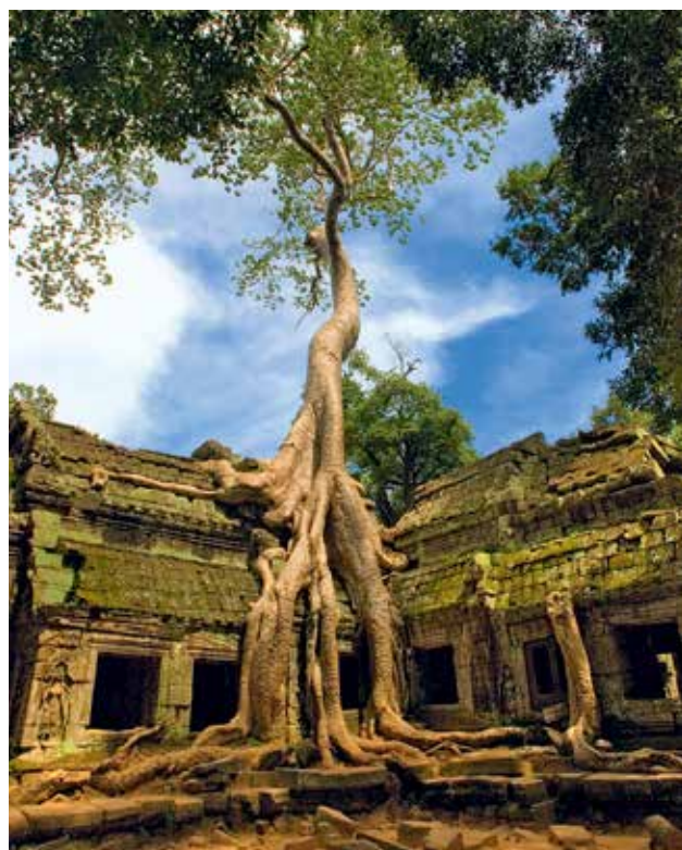
V SEVŘENÍ KOŘENŮ. V chrámu Ta Prohm se točil dobrodružný film Lara Croft.