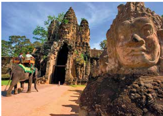
STRÁŽCE. Všechny brány do komplexu nazvaného Angkor Thom hlídají obří kamenné hlavy.

Návštěva Angkoru není levnou záležitostí. Jednodenní vstupenka v současnosti vyjde na 920 korun. Pouhý den ale na pořádný průzkum rozlehlého areálu rozhodně nestačí. Lepší je koupit si týdenní pas, který stojí dvojnásobek. Rozumným kompromisem je třídní lístek, který vyjde v přepočtu na 1500 korun. Angkor se na noc zavírá, turisté obvykle přespávají v některém z mnoha hotelů nebo penzionů ve městě Siem Reap. To je vzdáleno zhruba deset kilometrů od hlavního vstupu do archeologického areálu.