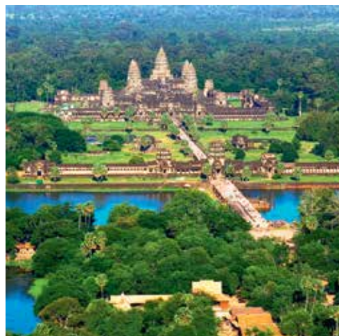
V DŽUNGLI. Chrámové město i dnes neustále obestírá prales.

V kambodžské džungli tak zřejmě na rozluštění čeká ještě docela dost tajemství.