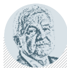
Jiří RUSNOK GUVERNÉR ČNB

Drama s korunou vrcholí, od nynějška už ČNB nebude dávat podnikům ohledně ukončení devizových intervencí vůbec žádné vodítko.