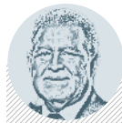
Salvador CERENÍ PREZIDENT SALVADORU

Parlament země rozhodl o kompletním zákazu těžby kovů. Salvador se tak stal první zemí na světě s touto restrikcí.