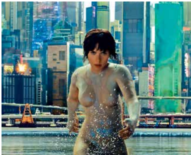
KYBERŽENA. Scarlett Johanssonová ve filmu vystupuje jako robot s lidským mozkem.

Letos přišel čas úspěšný asijský produkt rozšířit i mezi ty, kteří se o japonskou kulturu nezajímají. Přišli američtí producenti