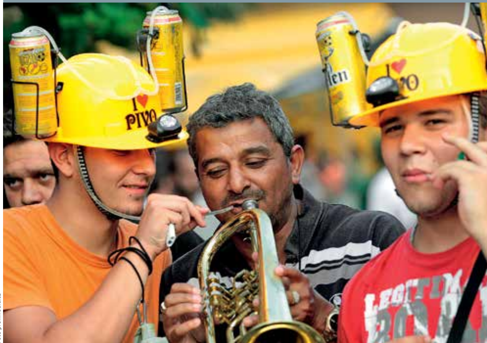
PIVO PO BALKÁNSKU. Společnost Apatinska Pivara s oblíbenou značkou Jelen je dosavadním lídrem srbského pivního trhu, na kterém si drží podíl 42 procent.