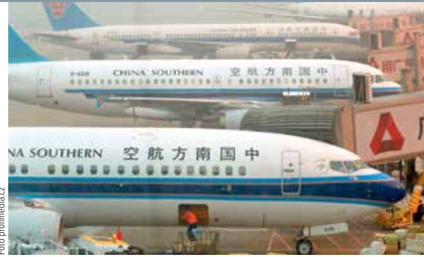
ČÍNSKÝ OBR. China Southern je největším z čínských státních leteckých přepravců.