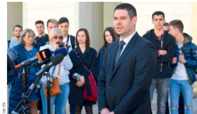
NOVÝ MINISTR. Prezident Miloš Zeman jmenuje Jiřího Havlíčka ministrem průmyslu a obchodu příští týden.

■ Ministerstvo průmyslu a obchodu včera ústy svého nastupujícího ministra Jiřího Havlíčka (ČSSD) odmítlo návrh ministerstva financí, aby závaznou nabídku na koupi černouhelné společnosti OKD podal státní podnik Prisko.