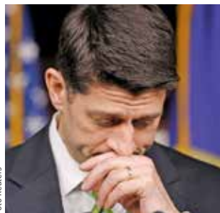
DEBAKL. Šéf republikánů Paul Ryan má nad čím přemýšlet.

brutální porážce a osudovém znamení pro prezidenta, který zrušení Obamacare považoval za hlavní pilíř svého vnitropolitického programu. Veřejnost i novináři nyní čekají na další Trumpovy