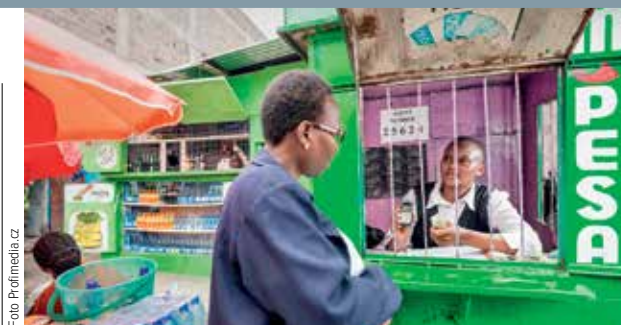
PREMIANT. Keňa je považována za pionýra mobilního placení.