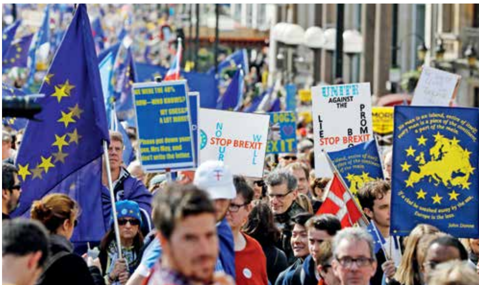
PROTESTY PROTI BREXITU. Příznivci setrvání Velké Británie v EU vyjádřili svůj názor před britským parlamentem.

Podle expertů tyto spory odrážejí fakt, že se unii stále nedaří vyrovnat se se dvěma krizemi. Jedna plyne z hospodářských problémů a nedostatků společné měny, druhá se týká migrace a bez-