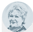
Alena VRÁNOVÁ HEREČKA

Čtyřiaosmdesátiletá legenda převzala cenu Thálie za celoživotní dílo. Herečka se proslavila pohádkou Pyšná princezna z roku 1952.