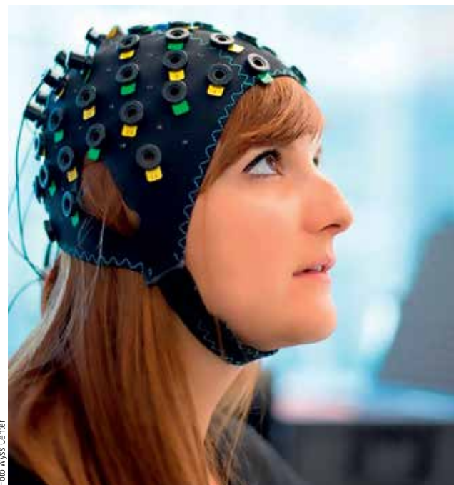
INTERAKCE. Speciální čepice umožňuje zviditelnit aktivity mozku při komunikaci s jiným člověkem.

Vědci hodlají tato zjištění použít nejen ke zdokonalení způsobů komunikace, ale také při vývoji umělých neuronálních sítí, které mohou být podle těchto principů naprogramovány pro lepší interakce s člověkem.