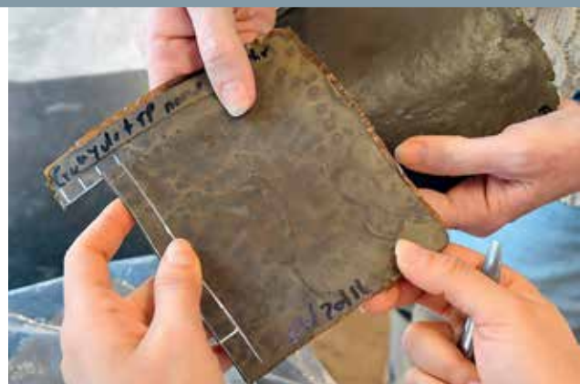
BUDOUCNOST PNEU. „Guma“ s přidavkem odpadu z potravin vykazuje skvělé mechanické vlastnosti. Jen černá není.

Nynější pneumatiky obsahují zhruba třetinu výplně, přesněji uhlíkové černi, díky níž získávají odolnost a jeví se opravdu černé. Výroba černi však závisí na ropě a jejich kolísavých cenách. Obdobné, ba dokonce lepší vlastnosti než černí dokážou pneumatice propůjčit i skořápky z vajec a slupky z rajčat. Ve správném poměru totiž zachovávají pružnost, a dokon-