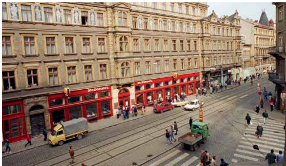
PREMIÉRA. Tak v době otevření zářil první McDonald's do šedi pražské Vodičkovy ulice.

Zatímco v domovských Spojených státech patří