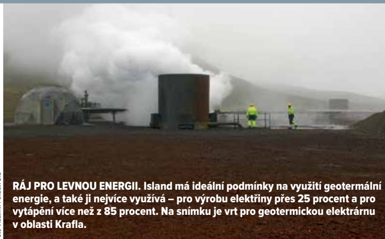
RÁJ PRO LEVNOU ENERGIÍ. Island má ideální podmínky na využití geotermální energie, a také ji nejvíce využívá – pro výrobu elektřiny přes 25 procent a pro vytápění více než z 85 procent. Na snímku je vrt pro geotermickou elektrárnu v oblasti Krafla.