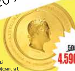
Ruská zlatá medaile Alexandra I.

Přijímáme umělecká díla a starožitnosti do aukce! +420 734 311 861 / +420 737 815 758 / info@arthousehejtmanek.cz