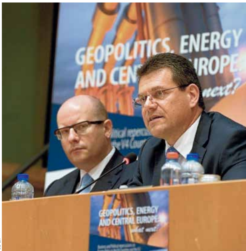
NESHODA. Rozdílný názor na zvýšení energetických úspor mezi premiérem Bohuslavem Sobotkou (vlevo) a místopředsedou Evropské komise pro energetickou unii Marošem Šefčovičem je spíše výjimka.

Místopředseda komise pro energetickou unii, Maroš Šefčovič ale upozornil, že většina zemi návrh naopak vítá. „My jsme si vymodelovali 27 procent, 30, 33, 37, a dokonce 40 procent. A nejdůležitější bylo najít nákladově nejefektivnější způsob. Jednoznačně nám vyplývalo – i vzhledem