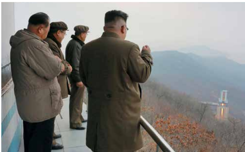
ZDAŘILÝ TEST. Severokorejský vůdce Kim Čong-un sleduje průběh úspěšného testu nového raketového motoru.

USA především chtějí donutit Čínu k většímu tlaku na Pchjongjang. Trump opakovaně obvinil Peking