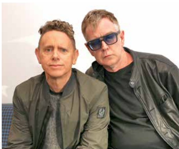
OTCOVÉ ZAKLADATELÉ. Martin Gore (vlevo) a Andy Fletcher (vpravo) při představení nového alba Depeche Mode Spirit.

Pozitivní zpráva je, že Depeche Mode budou moci nabídnout nejen staré ověřené fláky, stejně jako před čtyřmi lety, ale i písně