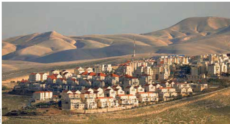
V POUŠTI. Maale Adumim, třetí největší židovská osada na Západním břehu Jordánu.

Na palestinském Západním břehu žije v osadách kolem 400 tisíc Izraelců. Palestinci osady považují za hlavní překážku mírového řešení izraelsko-palestinského sporu. /čtk/