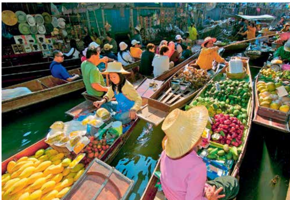
PLOVOUCÍ TRH. Dnes jde hlavně o turistickou atrakci a ceny proto stojí doslova „na vodě“.

Thajští diváci svůj sport milují a během zápasu vytvoří pořádný fanouškovský kotel. Atmosféru někdy