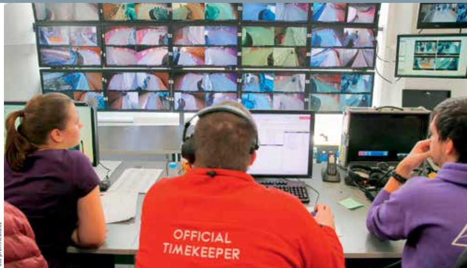
NA ČAS. Jedno z časoměřičských stanovišť OMEGA při ZOH v Soči 2014.