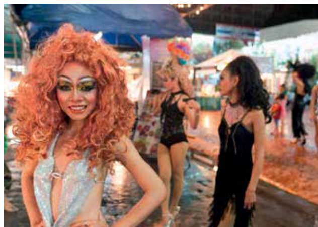
MUŽ I ŽENA. Ladyboyové na ulicích uvádějí vyzývavou koketerií západní turisty do značné nejistoty.

Pokud si ale turista osvojí toleranci, s níž přistupuje k ladyboyům thajská společnost, a zapře nevinný rozhovor, bývá s nimi docela vtipná konverzace. Ocenit lze také jejich vyhlášená vystoupení v místních kabe- retech. /stil/