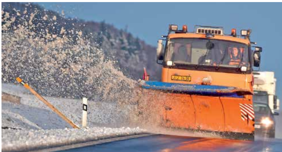
POPRVÉ. Stát soutěží údržbu silnic v takovém rozsahu poprvé. Dvě pilotní soutěže v minulosti proběhly pouze ve dvou krajích.

Obálky se otevíraly před několika dny. Celkem firmy na prvních místech požadují za údržbu ve čtrnácti oblastech 6,83 miliardy korun. Výrazně přitom bodují organizace a firmy v majetku krajů, které se soutěže nejvíce obávaly a žádaly po státu přímé zadání. Nyní se ukazuje, že v soutěžích jsou schopné a ochotné jít s cenou výrazně dolů, například na Vysočině