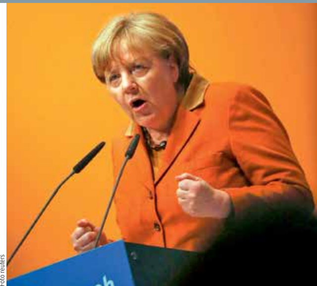
PŘÍMOČÁŘE. Politické projevy na Popeleční středu mají v Německu dlouholetou tradici. Politici při nich často v pivních stanech před stovkami posluchačů hovoří v bouřlivé atmosféře výrazně přímočařeji než při jiných příležitostech. Stejně tak Merkelová.

Le Penová není z kandidátů na prezidenta jediná, kdo má potíže se zákonem. Uchazeč umírněné pravice François Fillon čelí stíhání pro údajné obohacování rodiny z veřejných prostředků a na rozdíl od Le Penové se mu dávají jen malé šance na postup do závěrečného duelu. /čtk/