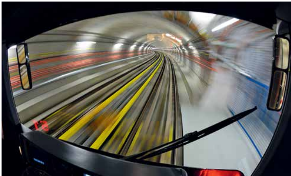
BOJ O SVĚTLO. Problémům s insolvenčními návrhy čelily firmy Hormen CE a Trevos poprvé v souvislosti s výstavbou prodloužení metra do Motola na trase A.