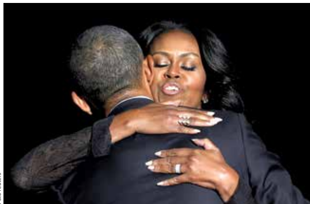
NEJEN PRO SEBE. Část vypsáných peněz darují Obamovi charitě.

Manželé Obamovi oznámili, že chtějí podstatnou část autorských honorářů věnovat charitě, mimo jiné i té, kterou založili – Obama Foundation. Více E15.cz