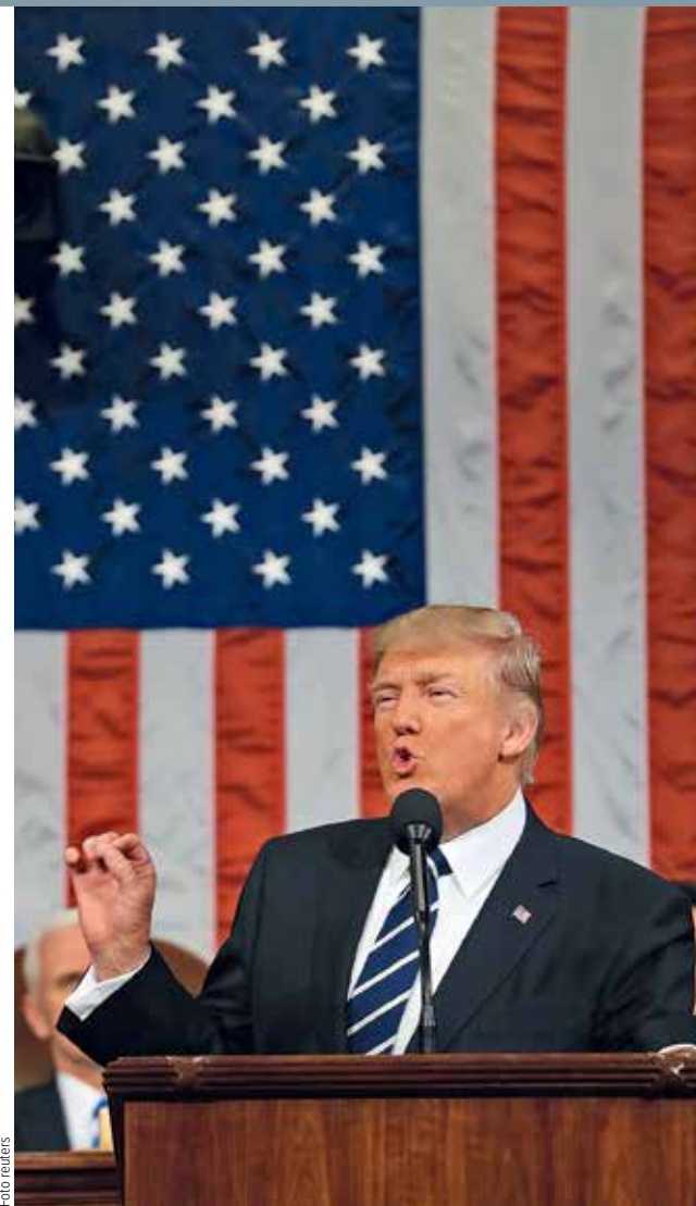
PŘES ATLANTIK. Na Trumpovo vystoupení v Kongresu – zejména pak na pasáž o rozsáhlých investicích do rozvoje infrastruktury – pozitivně reagovaly i evropské akciové trhy. Posílily tak, že se hlavní index německé burzy DAX po několika dnech vrátil nad psychologicky důležitou hranici 12 tisíc bodů.

„Trump zmírnil tón při nástupu svých známých plánů,“ nadepsaly články The New York Times. „Slyšeli jsme stejnou dávku vznešených slibů z jeho kampaně. Nevysvětlil ale, jak bude sliby realizovat, nemluvě o nákladech. Občas to vypadalo, že se stále ještě uchází o úřad, místo aby už funkci vykonával,“ uvedl newyorský list v úvodníku. /hý, čtk/