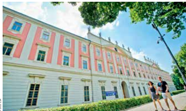
PAMÁTKA BEZ VYUŽITÍ. Národní památkový ústav by v Invalidovně mohl mít své sídlo. Část objektu by otevřel i pro veřejnost.

rozsáhlý objekt v Karlíně měl zůstat v rukou státu a mělo by se pro něj hledat nové využití. Památkáři po dražbě uváděli, že chtějí barokní areál otevřít veřejnosti i využít jako sídlo ústavu, případně jako sídlo některých dalších příspěvkových organizací ministerstva kultury i dalších rezortů. Rekonstrukce Invalidovny by mohla podle některých odborníků v případě generální opravy stát až 2,5 miliardy korun. /čtk/