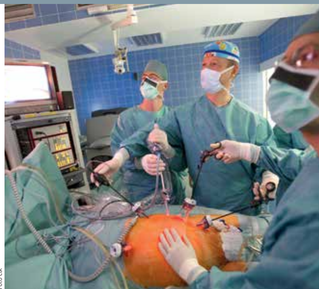
HLEDÁ SE NOVÝ MAJITEL. Dceřiná firma Homolka Premium Care nabízí pacientům individuální péči a přednostní vyšetření.

Pro nemocnici, která má zhruba 1800 zaměstnanců a roční obrát kolem tří miliard, by prodej firmy znamenal významné přilepšení. A potřebné. Nemocnice je