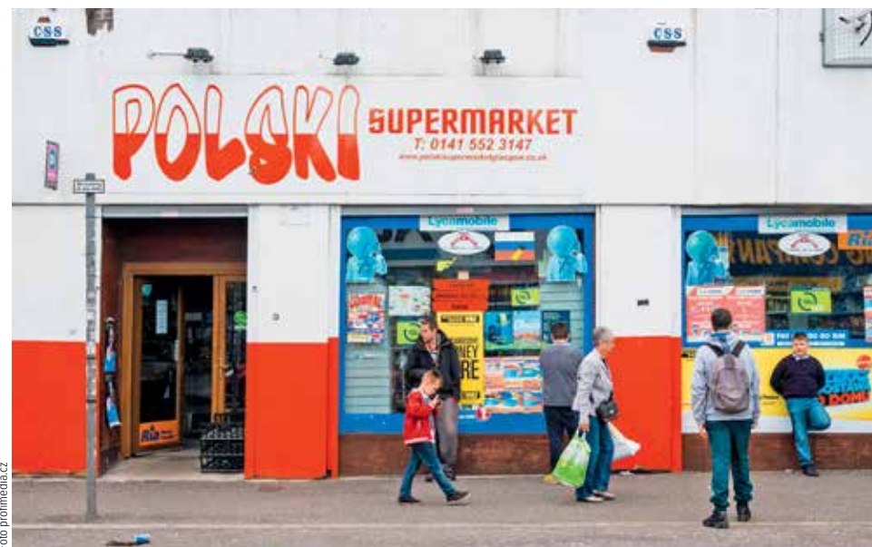
POLSKI SUPERMARKET. Ve většině skotských měst je dnes k vidění podobný obchod jako na Gallowgate v glasgowském East Endu.