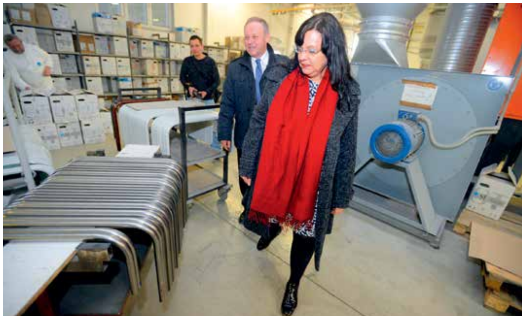
MINISTRYNĚ PRÁCE a sociálních věcí Michaela Marksová včera navštívila firmu Altech v Uherském Hradišti, která vyrábí kompenzační a rehabilitační pomůcky pro imobilní osoby.