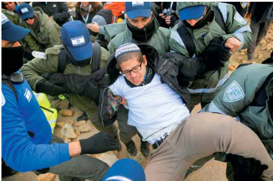
PROTESTY. Odpůrci evakuace už dříve oznámili, že hodlají protestovat. Podle policejního mluvčího Mickyho Rosenfelda se včera u osady pohybovalo asi 1500 aktivistů. Policistů bylo dvakrát víc.

Osadníci a jejich příznivci zapálili pneumatiky a příjezdové cesty zatrasili kameny. Protestující házeli kameny na policisty, kteří přišli neozbrojeni. Někteří z obyvatel se zamkli v domech, jiní se připoutali k těžkým předmětům, další nalili olej na silnici, po které postupuje policie. Několik rodin s malými dětmi odešlo