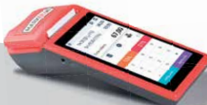
MARKEETA MINI / MINI POKLADNIČKA

Kompletní nabídku pokladen, tiskáren a dalšího příslušenství najdete na našich internetových stránkách.