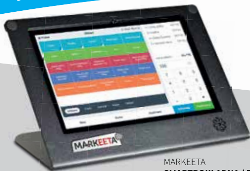
MARKEETA SMARTPOKLADNA / POKLADNIČKA