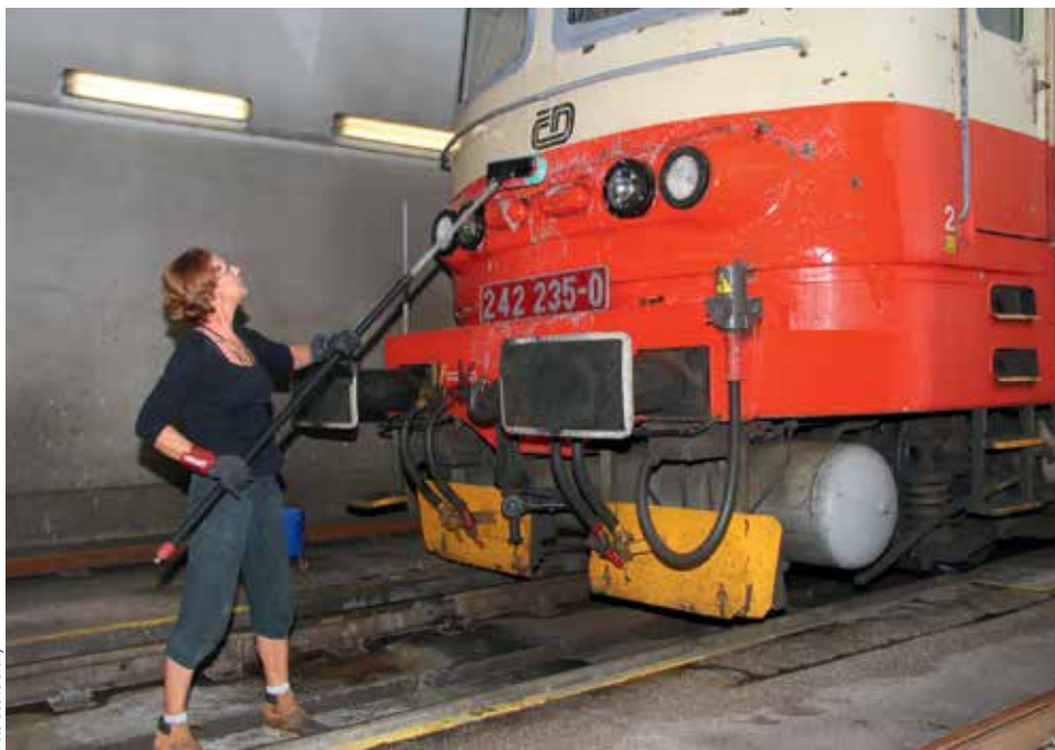
POMOC RIVALŮM. Zákon donutí České dráhy i jejich personál sloužit i konkurenci.