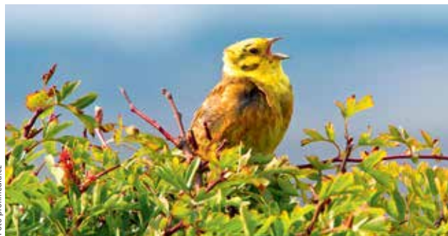
PTAČÍ DIALEKTY. Jen v Česku lze rozeznat několik nářečí strnadího zpěvu. O jejich zmapování se snaží projekt strnadi.cz.

Vědci od roku 2013 prozkoumali dvě stovky záznamů z Nového Zélandu a tři stovky z Velké Británie. Zachování ptačího nářečí přirovnávají k zastaralým lidským jazykům, jimiž se v některých oblastech dosud mluví – například v českých vesnicích v rumunském Banátu se dodnes používají archaická slova typická pro češtinu devatenáctého století. /čtk/