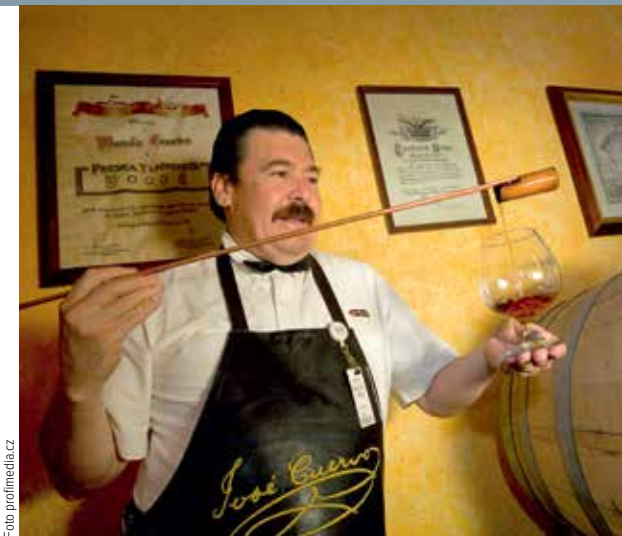
KONTROLA. Základ úspěchu je v důsledném sledování kvality. Vědí to i v palírně José Cuervo Tequila Distillery.