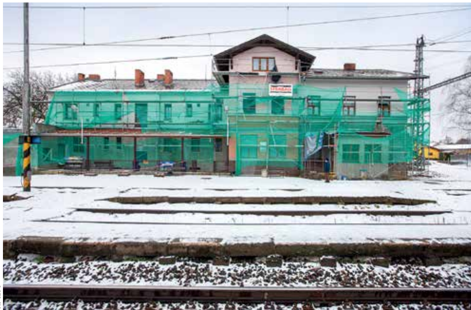
NOVÝ KABÁT. Železniční stanice Kostomlaty nad Labem se začala opravovat už loni v říjnu. Akce patří k těm malým, náklady činí 3,2 milionu korun.

s financováním rekonstrukcí, ale ten se týká jen budov na modernizovaných tratích či tratích určených k modernizaci. Na zbytek se podle Čočka najdou peníze ve státní pokladně. Ani po skončení záchranné akce ale nebude vše ideální. „Kdybychom chtěli všechna nádraží dát do normovaného stavu, tak by to stálo asi deset miliard,“ řekl ředitel stavebního odboru SŽDC Milan Čermák.