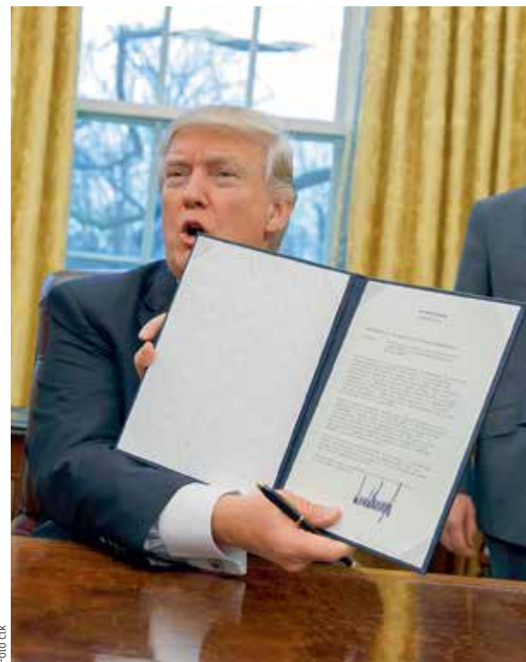
AMERICKÝ PREZIDENT Donald Trump včera podepsal exekutivní příkaz o odchodu USA z Transpacifického partnerství (TPP). Obchodní dohodu 12 tichomořských zemí vláda Baracka Obamy uzavřela před rokem, Kongres dokument ale ještě neratifikoval, a tak je Trumpův krok spíše formální. Experti ani neočekávali, že by kongresmani TPP ratifikovali, protože mezi Američany panuje obava ze ztráty pracovních míst. Trump odstoupení od smlouvy TPP sliboval už během své volební kampaně s tím, že ji nahradí dvoustrannými dohodami. Hodlá vyjednávat i s evropskými partnery o Transatlantické obchodní a investiční úmluvě mezi EU a USA, vůči níž má také výhody.