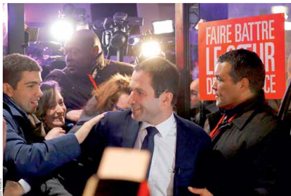
VĚŘÍ VE SVÉ POSELSTVÍ. Bývalý ministr školství Benoît Hamon po ohlášení prvních výsledků prohlásil, že jeho umístění v čele je poselstvím naděje.

procent hlasů voličů francouzské levice.