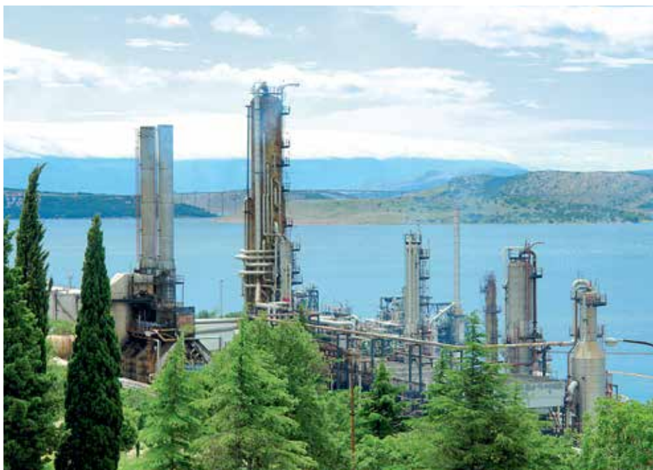
RIJEKA. Největší chorvatské ropné rafinerie jsou v jaderském přístavu Rijeka.

„Vyzývám všechny, kdo mají dobrý model pro tuto transakci, aby ho veřejně prezentovali. Zvážíme všechny možnosti a vybereme tu nejefektivnější tak, abychom nezvyšovali státní zadluž-