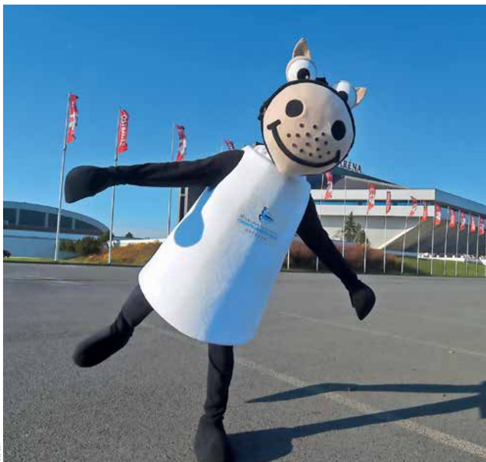
AXEL. Maskotem ostravského šampionátu je bílý koník. Fanoušci krasobruslení poslali přes sociální sítě několik set návrhů, jak by se měl jmenovat. Organizátoři z nich pak vybrali příhodné jméno Axel.