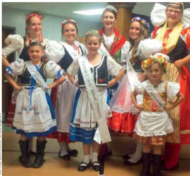
Foto miss czechislovak kansas pageant

Po vstupu Česka do Evropské unie se s uvolněním hranic „novodobá česká emigrace“ zvyšuje. Přesto není situace tak dramatická jako u dalších nových členských států. Rumunů odešlo jen po vstupu do EU na Západ za práci přes 2,5 milionu, pobaltské země ztratily skoro desetinu obyvatel. V kontextu aktuální diskuze o migraci nicméně vyplývá z počtu českých krajanů ve světě jedno zajímavé srovnání. V zahraničí žije v tuto chvíli pětkrát více Čechů, než kolik je naopak cizinců dlouhodobě pobývajících v České republice.