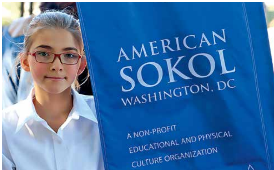
Foto american sokol washington

VLASTENCI ZA MOŘEM. Aktivní je například česká komunita v americkém Kansasu, která si volí i vlastní miss v lidovém kroji.