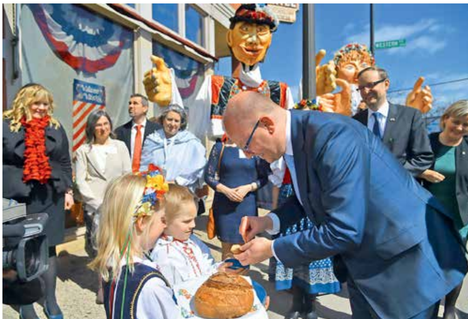
NOVÝ DOMOV. Největší krajská komunita působí ve Spojených státech. Žije tam 1,7 milionu Čechů.

V zahraničí žije v současnosti až 2,5 milionu Čechů. Vyplývá to z odhadu českého ministerstva zahraničních věcí. Zdaleka přitom nejde jen o Čechy, kteří se vydali v novodobé éře do světa za prací. Stále jsou ve světě aktivní minimálně tři stovky tradičních krajských spolků. Jde o rodiny, které jsou usazeny v cizině už třeba v šesté nebo sedmé generaci.