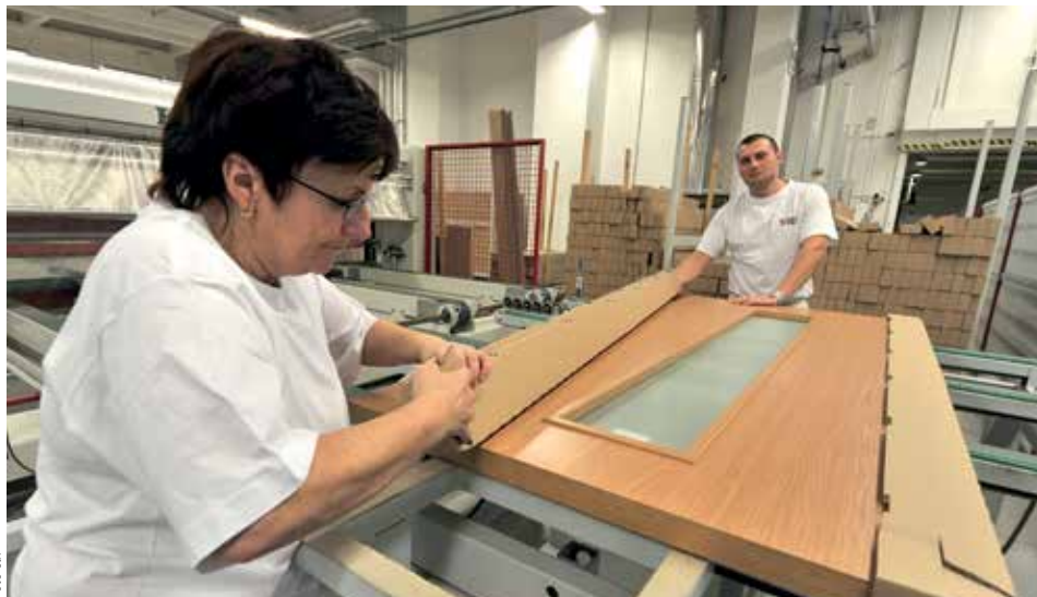
BOJ O LIDI. Sapeli zaměstnává přes tři sta pracovníků. V Jihlavě se o ně přetahuje například s koncernem Bosch.

„Po více než dvaceti letech, kdy jsme fungovali jako výrobní firma, potřebujeme dostat pod kontrolu i prodejní část,“ řekl šéf