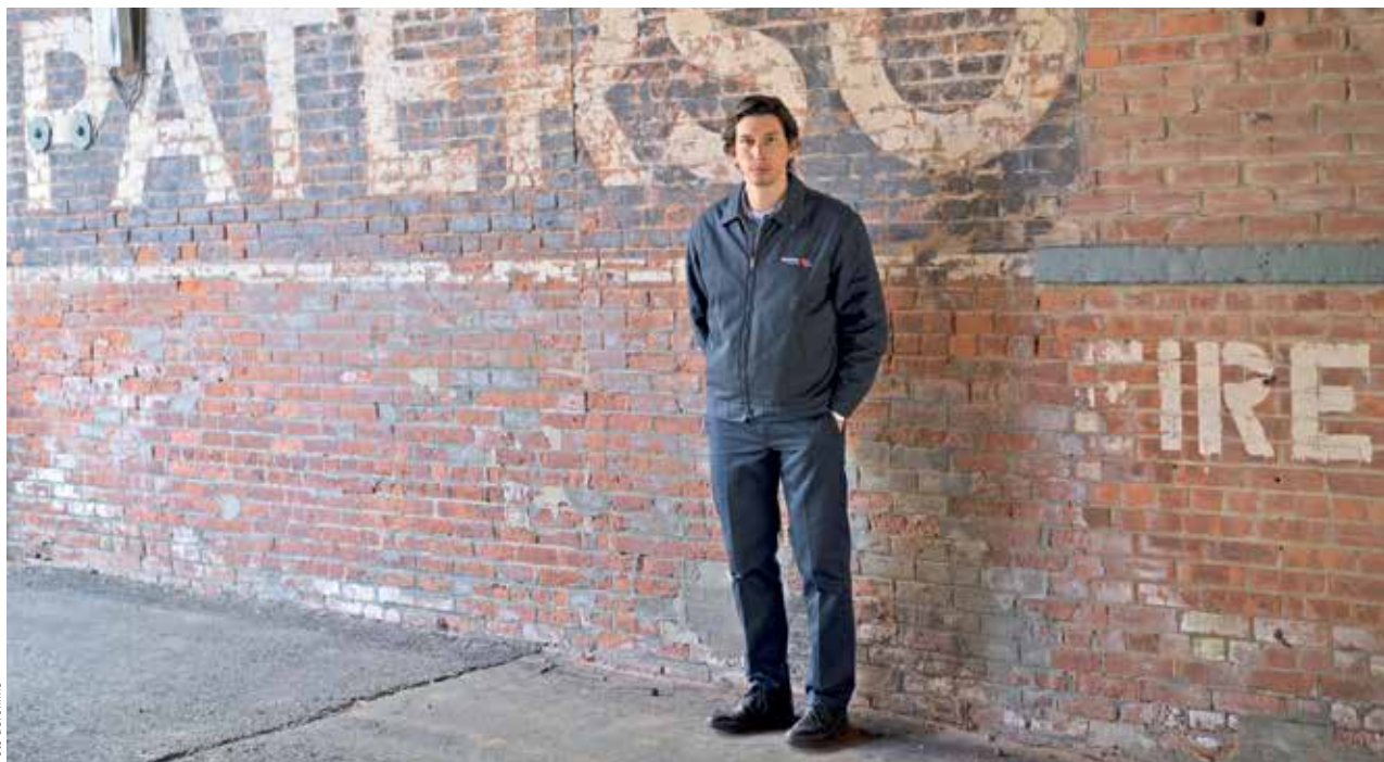
MĚSTSKÝ BÁSNÍK. Řidič Paterson (Adam Driver) z Patersonu si umí všimnout všedních maličkostí.

Paterson je přesto křehký snímek, který jako každá dobrá báseň dokáže v divákově otevřít srdce a nechat ho otevřené. Rozcitlivět ho směrem ke vnímání krásy i melancholie obyčejnosti. Vyvolat v něm emoce, jež se těžko překládají do slov. Což víceméně omluví, že samotné Patersonovy verše psané