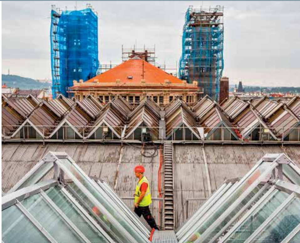
OCELOVÉ DÍLO. Rekonstrukce haly, která kryje nástupiště hlavního nádraží, bude nakonec dražší. Příčinou je rez, která na konstrukci zanechala větší zkázu, než se počítalo.

Rekonstrukce začala počátkem loňského roku, její dokončení se očekává letos na podzim. Stavbu provádí konsorcium Metrostav – Prominecom po etapách, neboť je třeba zachovat na nádraží vlakový provoz. Kapacita nádraží je stavbou