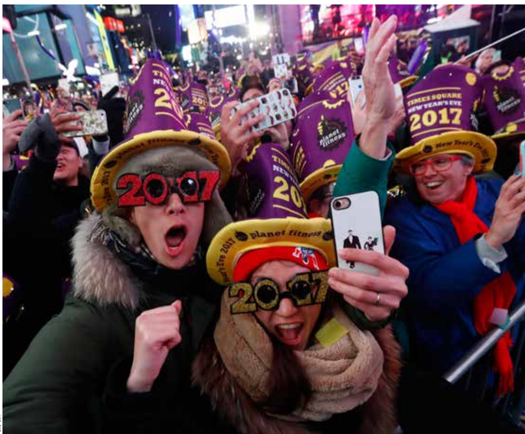
NEW YORK. Asi milion lidí obklopených bezpečnostním prstencem mohutných nákladních automobilů a sedmi tisíc příslušníků policie na náměstí Times Square uvítal příchod nového roku tradičním sledováním klesající kaleidoskopické koule.