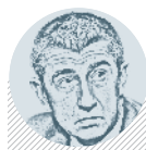
Andrej BABIŠ MINISTR FINANČÍ

V minulých volbách bral hlasy pravici. Pokud se chce stát premiérem, musí nyní oslovit především příznivce ČSSD a KSČM. str. 2