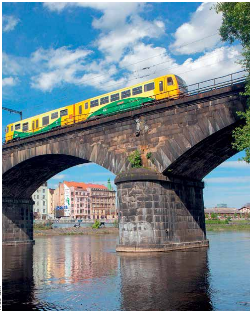
DOPRAVNÍ OMEZENÍ. K největším letošním akcím souvisejícím se železniční dopravou má patřit rekonstrukce Negrelliho viaduktu, která výrazně zkomplikuje příměstskou dopravu v Praze.

Na českých dálnicích ještě nikdy nebyl takový provoz jako v roce 2016, pokud vezmeme jako hlavní kritérium zájem o dálniční kupony a mýtné pro kamiony. Státní fond dopravní infrastruktury prodal 5,8 milionu dálničních známek pro rok 2016, když z emise pro rok 2015 se udalo o 400 tisíc kusů méně. Loňská čísla jsou uváděna ke konci listopadu, prosinec už ale na nich nic nezmění.