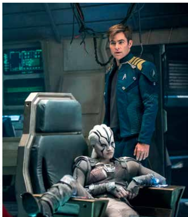
SÁZKA NA JISTOTU. Alibaba v loňském roce financoval vznik nejnovějšího dílu z filmové série Star Trek.