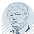
Donald TRUMP PREZIDENT USA

V minulých volbách bral hlasy pravici. Pokud se chce stát premiérem, musí nyní oslovit především příznivce ČSSD a KSČM. str. 2