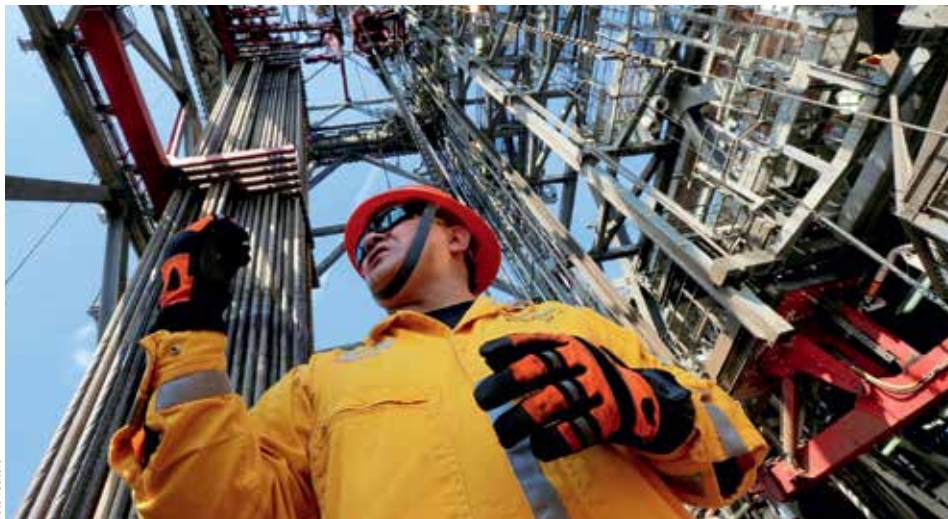
OMEZENÍ TĚŽBY. Ropní giganti budou letos těžit maximálně 33 milionů barelů denně.

Rozhodne, jak se budou země OPEC řídit svým závazkem udržet těžbu o 1,2 milionu barelů denně nižší než loni. „Pracoval