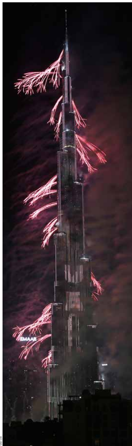
DUBAJ. Také ve Spojených arabských emirátech se ujalo vítání nového roku přívalem dělbuchů, rachejtli, ohňů a prskavek (na snímku je nejvyšší budova světa Burdž Chalífa). Pozoruhodné je, že v pravlasti zábavní pyrotechniky Číně byl včera klid. Tam podobný bengál vypukne až 28. ledna, kdy rok ve znamení Opice vystřídá rok ve znamení Kohouta.