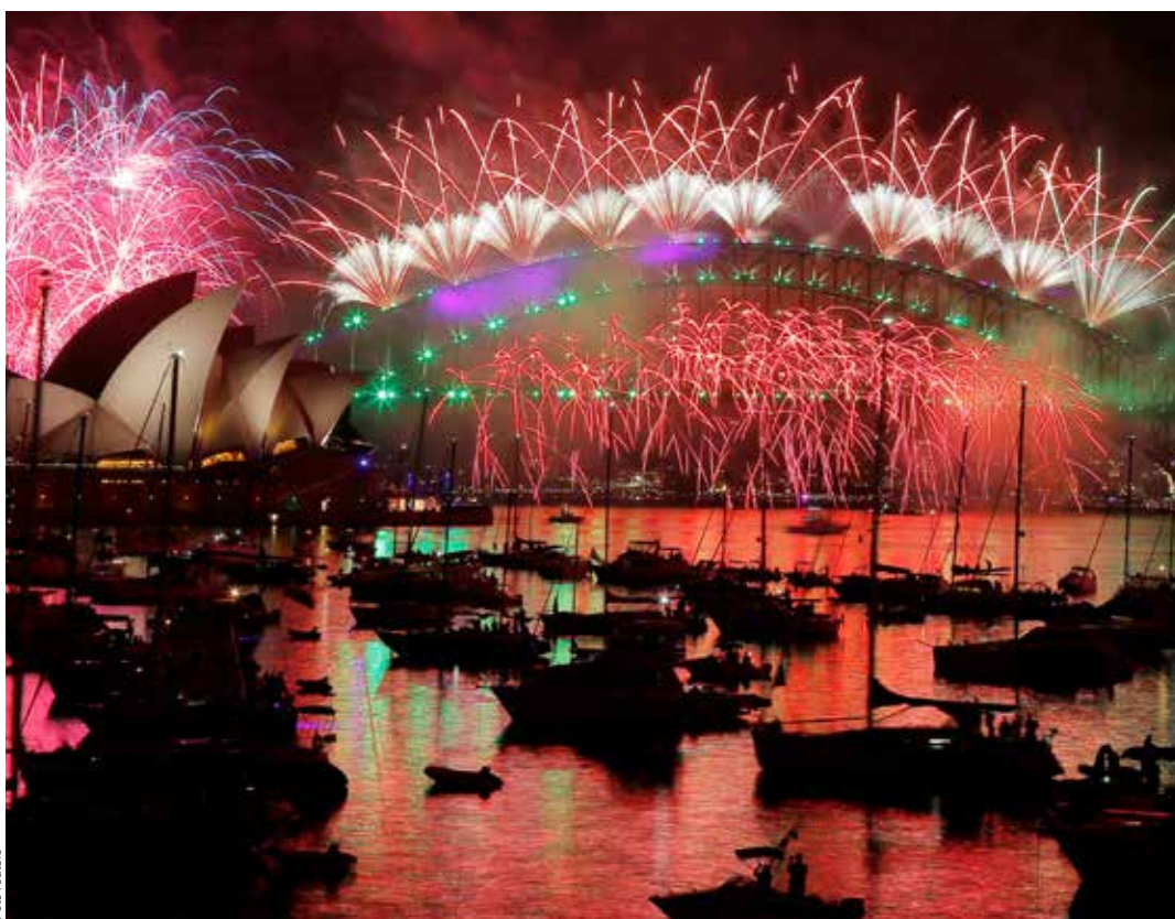
SYDNEY. Více než milion lidí se přišel podívat do centra města na dosud největší ohňostroj k uvítání nového roku. Sydneyská radnice na něj vydala v přepočtu téměř 130 milionů korun. Organizátoři pak vypálili více než sto tisíc rachejtli. V okolí ikonické budovy městské opery panovala přísná bezpečnostní opatření. Ulice vedoucí do centra pětimilionové metropole byly zatarasené napříč stojícími autobusy.