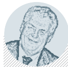
Miloš ZEMAN PREZIDENT ČR

Od nastupujícího prezidenta čekají jeho voliči řadu změn v domácí i zahraniční politice. Nastupující rok ukáže, nakolik jsou jeho sliby reálné. str. 12