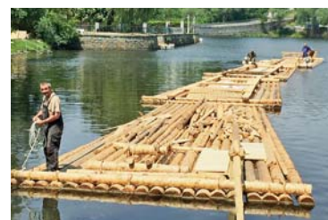
Brno je dobrý lesa pán. Už 550 let 14