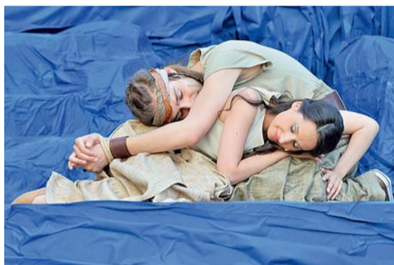
▲ Panna a královic. Přes všechna úskalí si k sobě vždy najdou cestu.