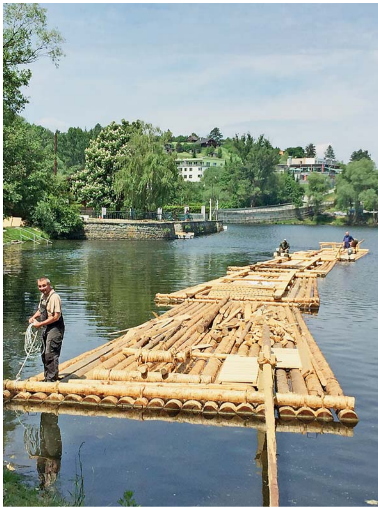
▲ Sedmdesátimetrový vor. Jako připomínku 550. výročí založení postavili pracovníci Lesů města Brna na přehradě dřevěný vor. Zájemci se na něm mohou projet.

Vlastníkem svého původního majetku se město Brno znovu stalo až po sametové revoluci. V roce 1992 byla zřízena příspěvková organizace Lesy města Brna, která se později změnila na společnost s ručením omezeným a od