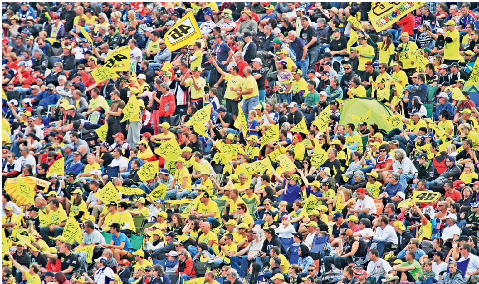
Plné tribuny. Masarykův okruh je mezi závodníky oblíbený i díky fanouškům. Snímek je z loňského roku.