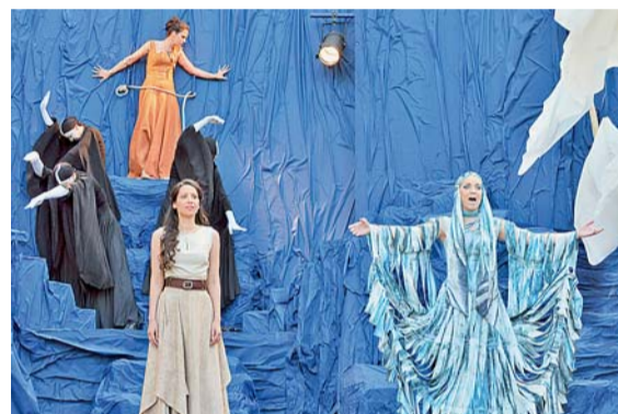
▲ Matka Země. Královna Runa zamilovanou dvojici v jejím jménu proklela.