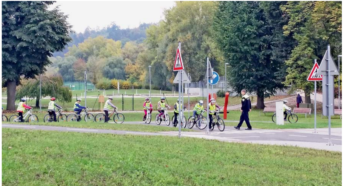
Na kole bezpečně. Děti se mohou o prázdninách na dopravním hřišti naučit, jak bezpečně jezdit na kole.

„Hlídku městské policie se i nadále zapojovala do oživování, které na místě trvalo přibližně půlhodinu. Muži se životní funkce v danou chvíli podařilo obnovit, následně byl převezen do nemocnice a případ