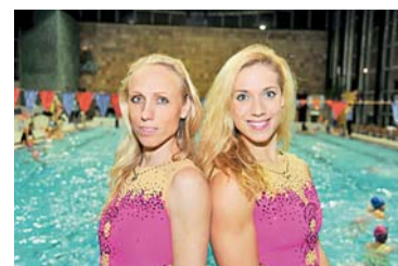
I Brno bude mít na olympiádě v Riu své zástupce 23