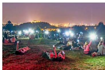
Planetárium v létě zve na pozorování i představení 12-13