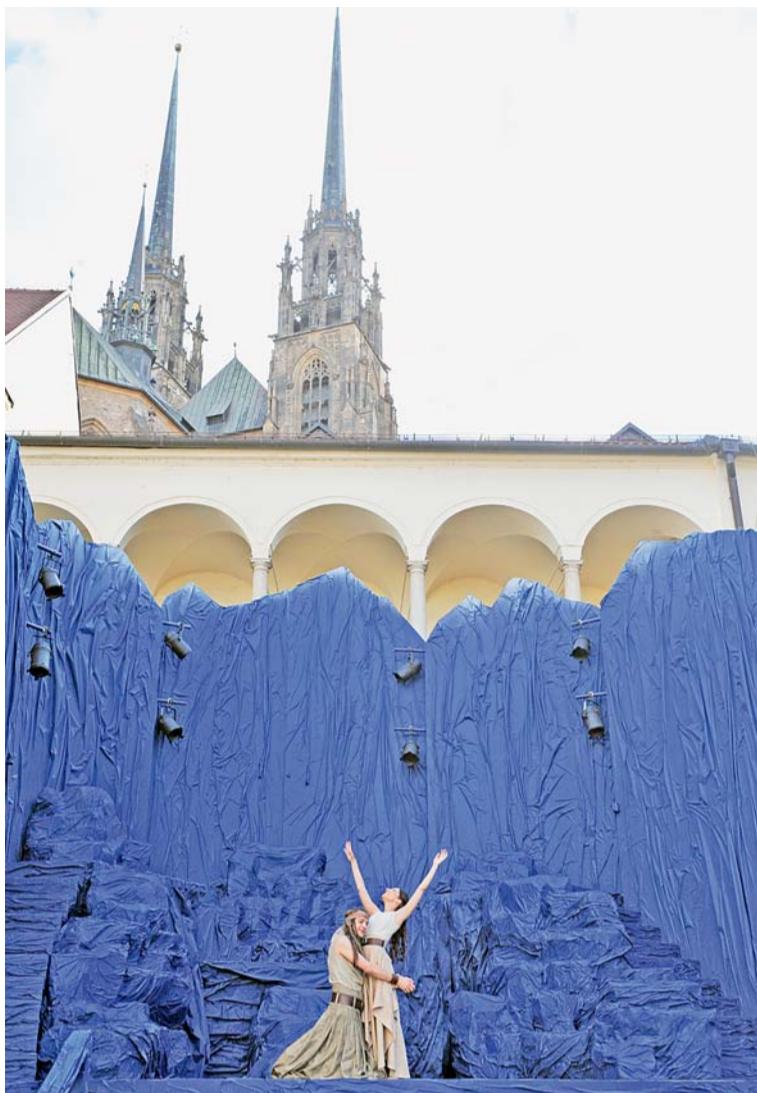
▲ Láska pod Petrovem. Když Mahulena dala Radúzovi napít z dlaní, zamilovali se do sebe.

V polovině června se Biskupský dvůr pod Petrovem proměnil v letní scénu. Městské divadlo Brno tam zahájilo již sedmý ročník letního seriálu open-air představení. Jedním z nich byla i muzikálová legenda Radúz a Mahulena, která se na brněnské jeviště vrátila po čtrnácti letech.