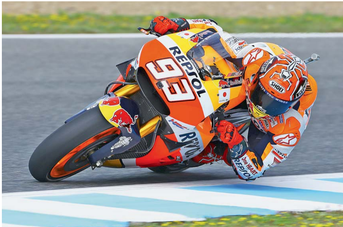
▣ Talent a dřina. U nadaného mladíka se sešly všechny pozitivní faktory a dnes je z něj mistr světa.

Závod se vám občas nepovede na každé tratiť. Šance, že bych v sezoně 2014 vyhrál všechny závody, byla minimální. Jednou to prostě muselo přijít a musel jsem prohrát. A bohužel se to stalo zrovna v Brně.