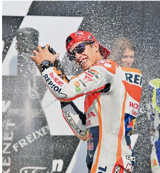
▣ Repsol Honda. Kvůli přestupu závodníka musel tým žádat o výjimku. Vyplatilo se.

Kde se „fenomén Marquez“ vzal? U talentovaného mladíka se sešly všechny pozitivní faktory. Narodil se ve Španělsku, kde jsou motoru národní sport. Měl slušné rodinné a finanční zázemí. Měl hodně štěstí a ještě víc talentu. Na motocyklu