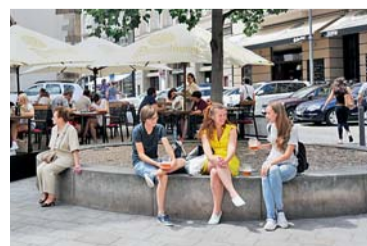
Brno o prázdninách ani zdaleka neusíná 8