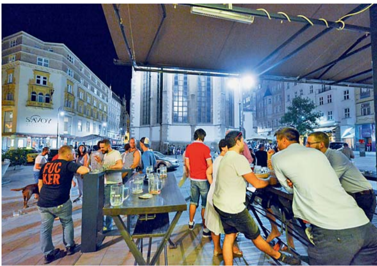
Živé centrum. Jakubské náměstí je plné lidí i během letních prázdnin.