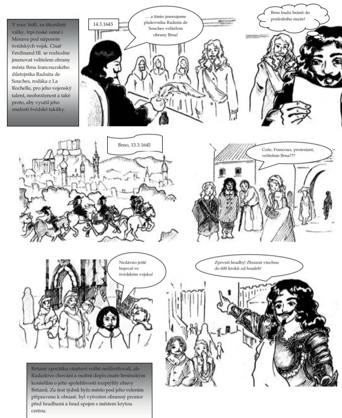
▣ Komiks o Brně. Spolek přátel Raduit de Souches vydává komiks o obraně Brna za třicetileté války. Sledovat ho můžete na jejich Facebooku.

aneb Jak francouzský důstojník Brno zachránil