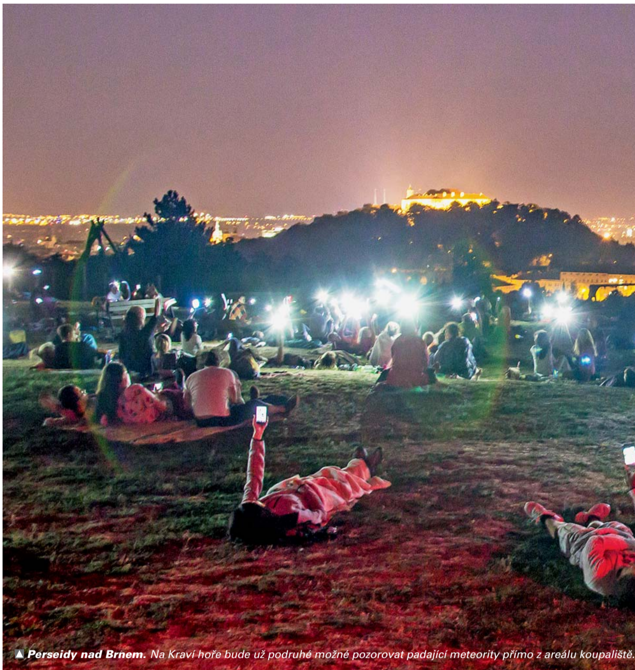
▲ Perseidy nad Brnem. Na Kraví hoře bude už podruhé možné pozorovat padající meteority přímo z areálu koupaliště.

Většina expozic bude s výjimkou krytého bazénu volně přístupná. Umožní-li to počasí, bude možné i pozorovat samotný Měsíc. Úplňková noc začne v devět hodin večer a skončí po druhé hodině ránní.