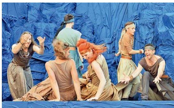
▲ Královské sestry. Přišla i Živa se umí bavit. Oproti nejmladší Mahuleně jsou však chladné a zlé.

Nezapomenutelné melodie Petra Ulrycha s krásnými texty Stanislava Moší můžete na Biskupském dvoře zhlédnout ještě 3.–7. července. (LUK)