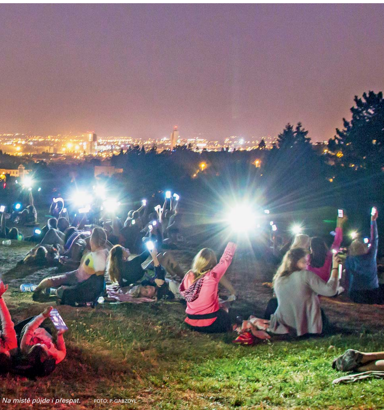
Na místě půjde i přespat.