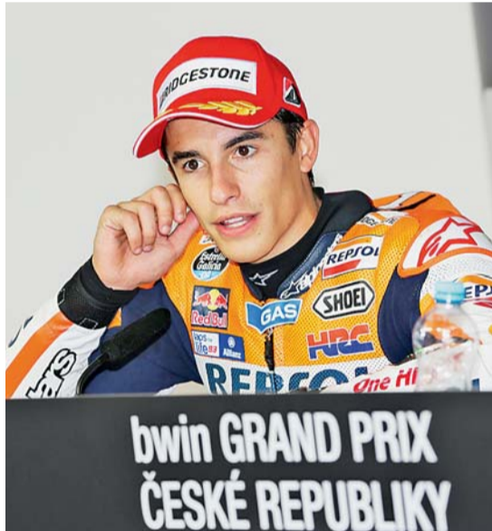
▣ Vítězná série. V roce 2014 Marquez na Masarykově okruhu poprvé v sezoně nezlomil.

Který okruh je naopak ten nejoblíbenější?