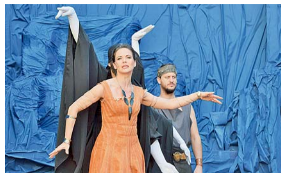
▲ Královna Runa. „Magurský královci, hodím tě mezi krysy! Co ti kdy bylo krásné, navždycky bude kdysi!“