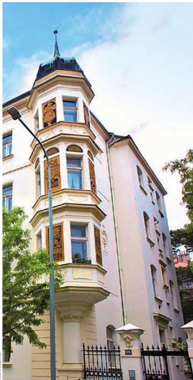
NÁKUPNÍ HLAD. Domy na dobrých adresách, k nimž patří pražský Karlín, vzbuzují zájem donedávna v Česku nevidaných investorů.

Podobnou cenu zaplatila při vstupu do České republiky a na Slovensko také australská investiční banka Macquarie. Původně kroužila kolem největšího developera skladů a průmyslových hal CTP. Nakonec se však na pře-