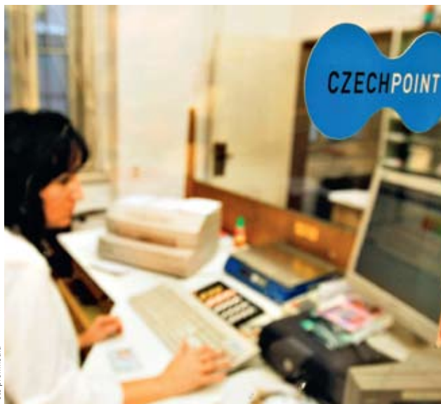
ELEKTRONIZACE STÁTNÍ SPRÁVY. Jednou z již déle fungujících služeb e-governmentu jsou kontaktní místa Czech Point.

„Není žádným tajemstvím, že máme velké zpoždění, velké mezery, ale i velké pří-