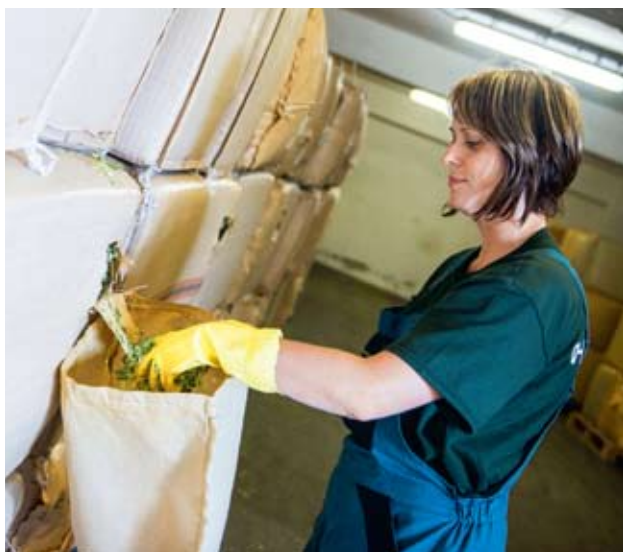
OVĚŘENÝ PŮVOD. Dnes je již možné vysledovat cestu chmele od pivovaru až ke konkrétní chmelnici. Systém certifikace brání pokusům vydávat méně kvalitní chmel za špičkový poloraný červeňák.