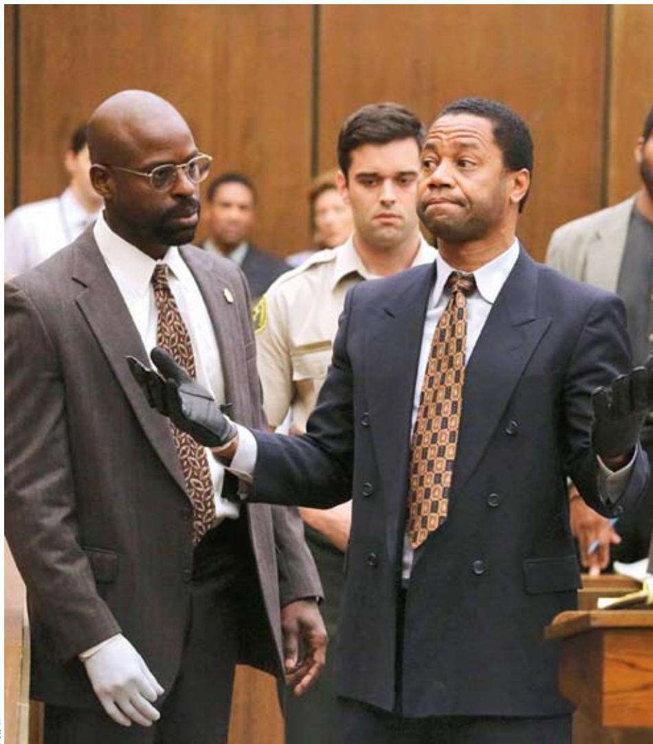
FAVORIZOVANÁ REKONSTRUKCE. Minisérie Lid vs. O. J. Simpson patří spolu s Hrou o trůny k nejpravděpodobnějším vítězům mnoha cen Emmy.