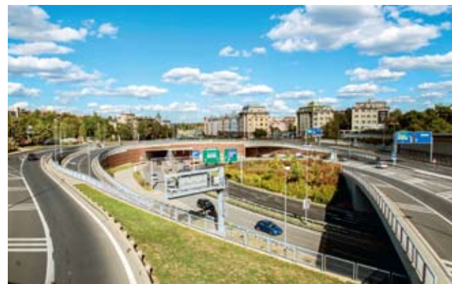
TUNELOVÉ BLUDIŠTĚ. Blanka umožňuje rychlý průjezd Prahou. V některých místech ale naráží na limity okolní dopravní infrastruktury.

Vedení města výtky odmítá. Podle náměstka Petra Dolínka je třeba dobudovat další infrastrukturní stavby. Blanka podle něj trpí tím, že není dokončen vnitřní ani vnější silniční okruh Prahy. „Blanka je sirotek, to se nám v průběhu roku také ukázalo a projevuje se to v momentě, kdy je tunel uzavřen a řidiči musejí jezdit po povrchu. Je