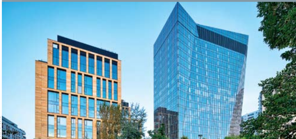
MODERNÍ KANCELÁŘE. Realitní transakce se týká dvou budov v projektu Gdansk Business Center.