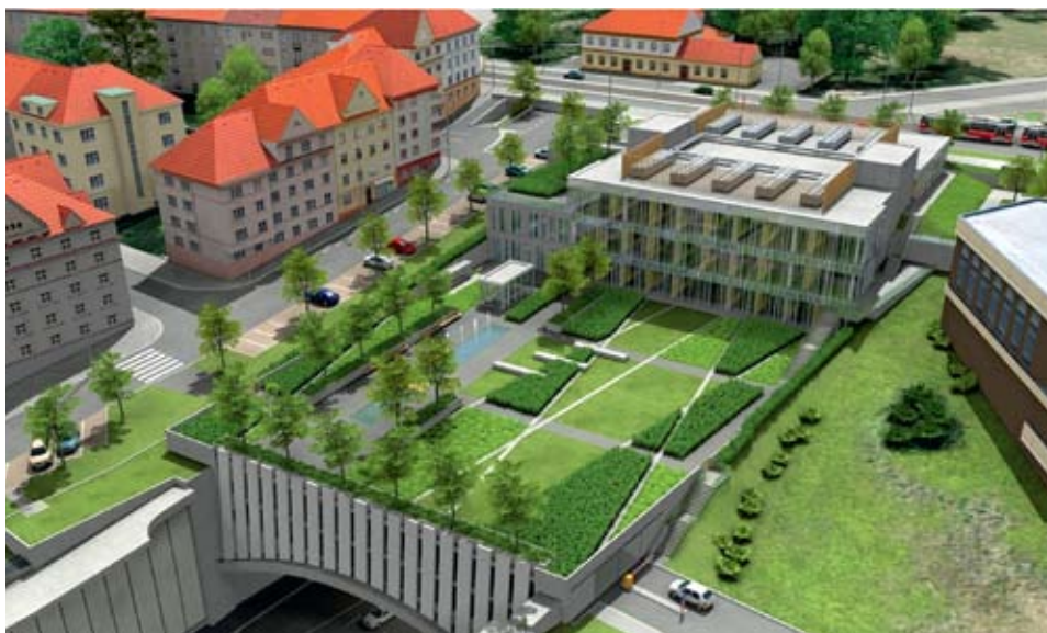
CENTRÁLA NA MALOVANCE. Nad severním vyústěním Strahovského tunelu, v proluce vedle hotelu Pyramida, vyroste budova, ze které bude řízena doprava v Praze.