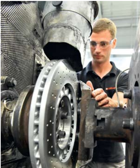
VÝROBCE BRZDOVÝCH DESTIČEK Federal-Mogul Holdings Corporation otevřel v Brně laboratoře za 25 milionů korun. Budou testovat a vyvíjet brzdové díly, jež se montují téměř do všech známých osobních i nákladních vozů.