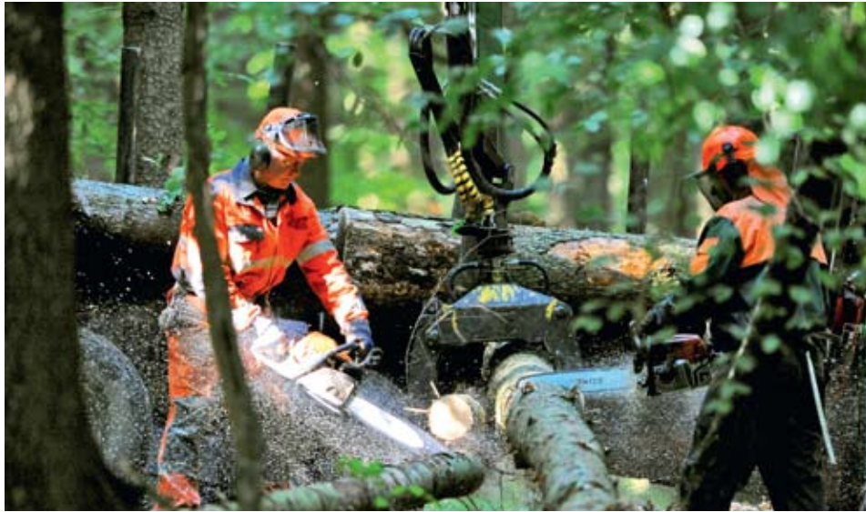
KALAMITA. Firmy těží kůrovce dříví především na severní Moravě a ve Slezsku, kde je situace nejhorší. Na jejich práci navazují železniční přepravci.

Těžaři zasahují především na severní Moravě a ve Slezsku, kde je situace nejhorší. Vedle nich se přitom číní také železničáři. ČD Cargo za