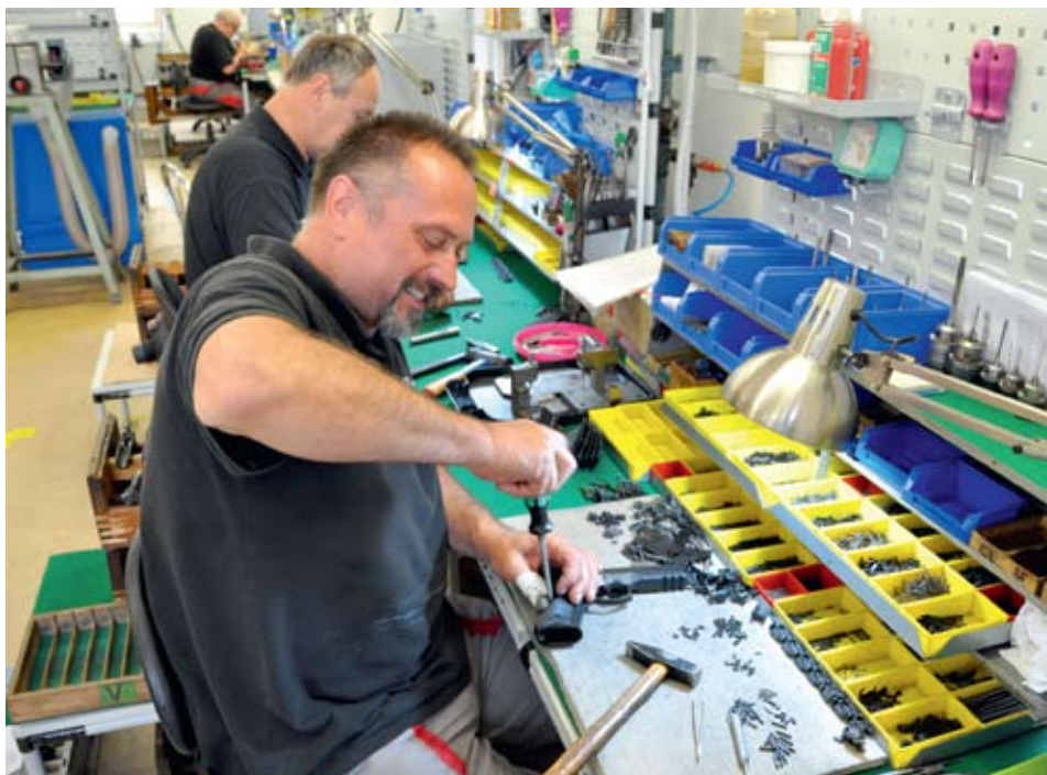
PAS JE POVINNÝ. Pracovníci v dílně konečné montáže, stejně jako všichni zaměstnanci, jsou vlastníky zbrojního pasu.

odvezli všechny důležité součásti strojů. Po válce byl podnik znárodněn a začalo vyšetřování členů vedení. Nejhůře dopadl bývalý technický ředitel, český Němec Ignatz Uhl, který dostal trest smrti.