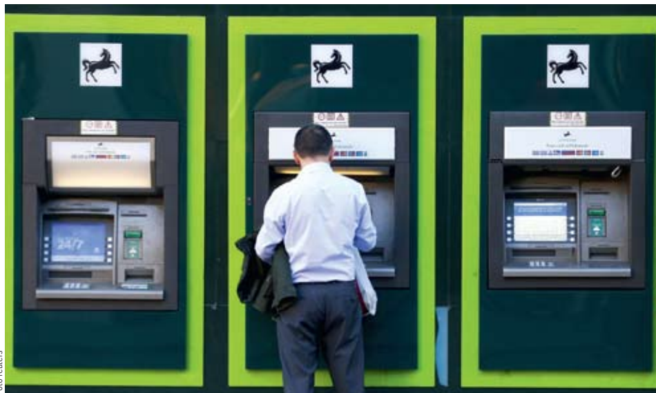
NEJISTOTA. Britskou měnu i včera srážela nejistota ohledně dopadů rozhodnutí Británie opustit Evropskou unii a dohady, že britská centrální banka sníží úrokové sazby.

Britské v ale unii otrásl ostrovním bankovním průmyslem. Jen akcie čtyř největších bank z londýnské City ztratily od oznámení brexitu zhruba čtvrtinu své hodnoty, což odpovídá sumě kolem 40 miliard liber. Pokud některé z ekonomických odvětví může na nezávislé Británii podstatně tržit, mohou to být podle odborníků právě banky. Opuštěním osmdvacítky mohou totiž britští finančníci přijít o volný vstup na jednotný unijní trh. Na bedra bank by tvrdě dopadlo i ochlazení ekonomiky, podpůrné akce centrální banky, ale i prostý odliv talentů.