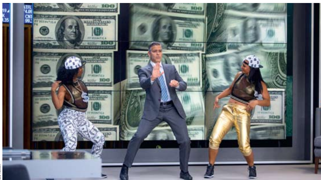
AMERICKÁ SHOW. Dokáže ještě egocentrický moderátor (George Clooney) uvěřit v morální pravidla?