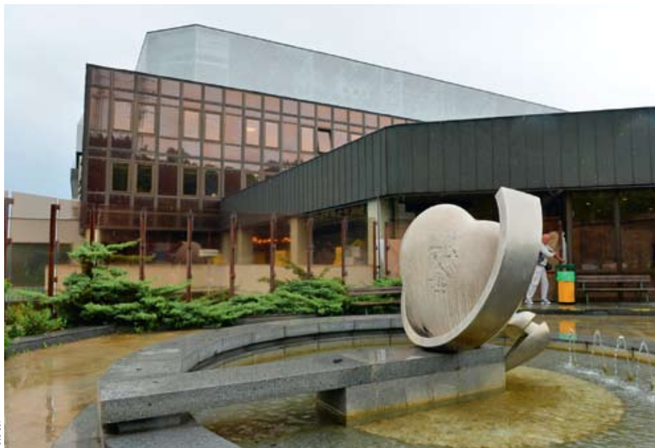
PRO A PROTI. K systému nákupu na Homolce se na žádost ministerstva zdravotnictví v červnu 2015 vyjadřoval antimonopolní úřad. Podle něho nemocnice oprávněně využila výjimku.

Ani po půl roce není dořešeno odvolání Nemocnice Na Homolce proti téměř třímilardové pokutě za obcházení zákona o veřejných zakázkách. Hrozba může viset nad prestižní nemocnicí do půlky letních prázdnin. Odvolací finanční ředitelství si prodloužilo lhůtu na rozhodnutí.