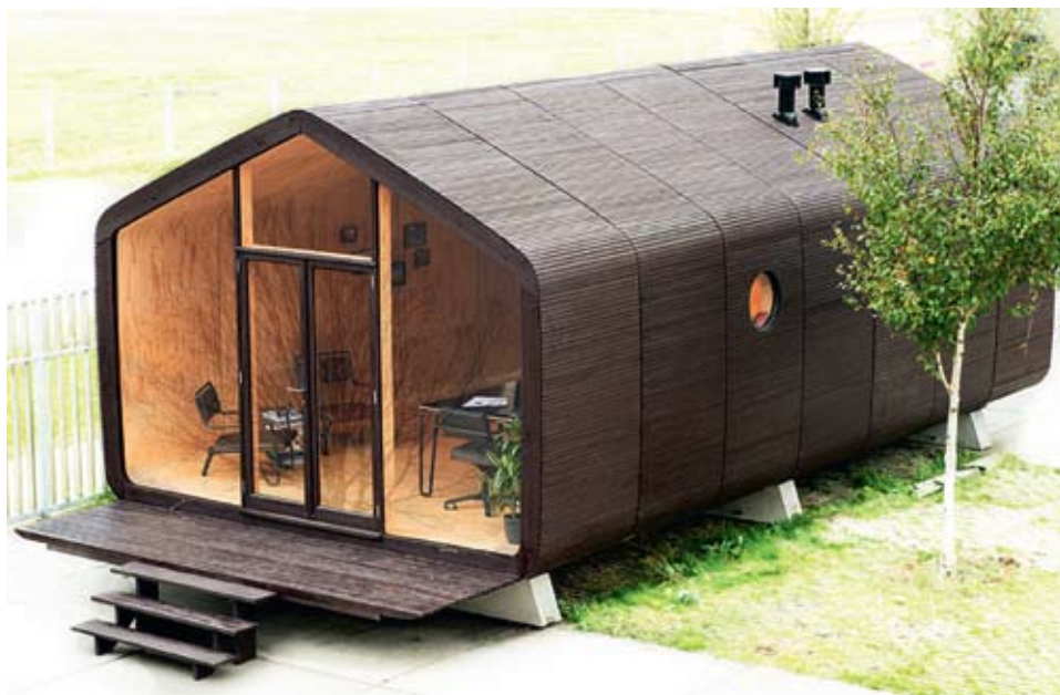
MINIMALISMUS. Idylicky a trochu pohádkově působí domek sestavený z bloků Wikkelhouse.

Fiction Factory předpokládá, že Wikkelhouse