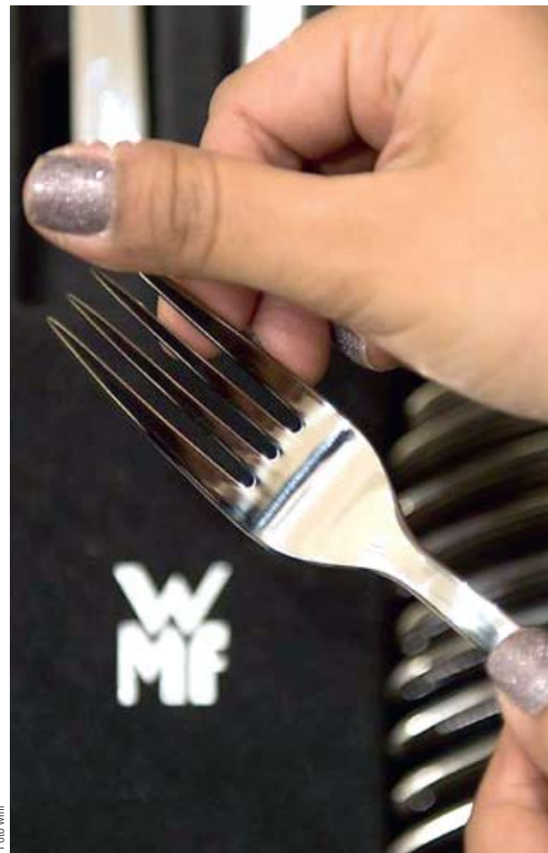
ROZŠÍŘÍ PORTFOLIO. Francouzský SEB již vyrábí spotřebiče Tefal, Rowenta a Moulinex. Za německou WMF Group vydal přes miliardu eur.

Advokáti – investoři, kteří svět paragrafů neopustili, čelí kritice z vlastních řad.