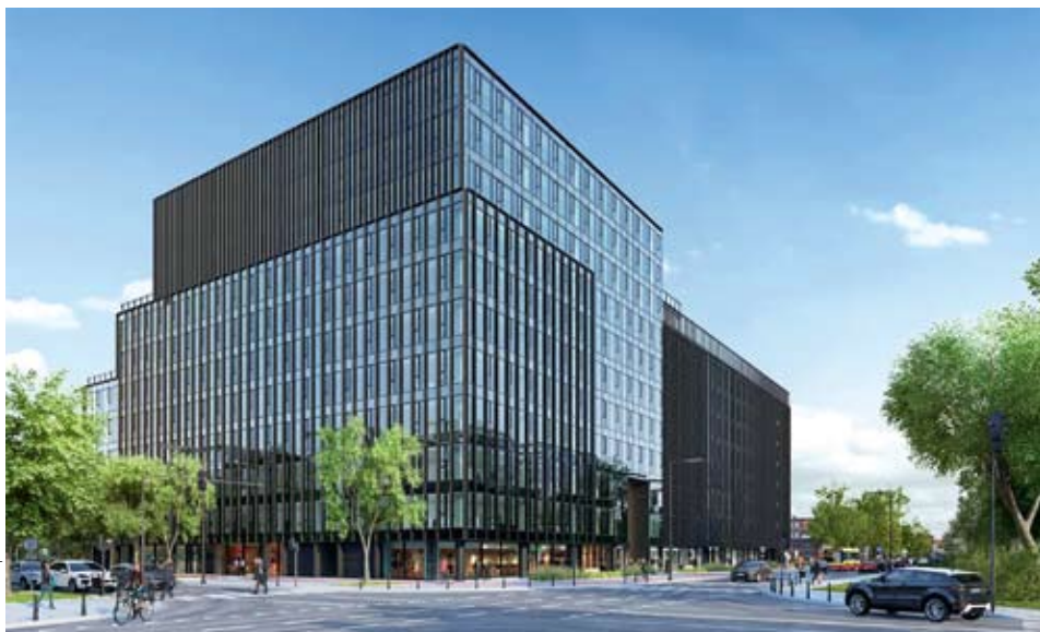
PRVNÍ V POLSKU. Administrativní centrum za 1,2 miliardy korun se dostává do ostré fáze výstavby.