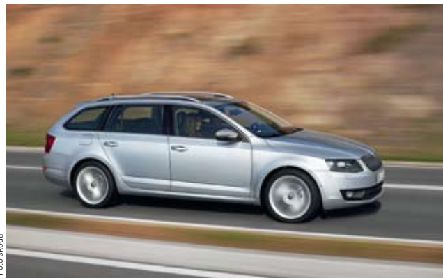
LITROVÝ TRÍVÁLEC. Škoda začala nabízet model Octavia poprvé s litrovým tříválcovým motorem. Má vyšší výkon i točivý moment než dosavadní čtyřválcový základ 1,2 TSI (na snímku). Proti němu má i nižší spotřebu.

Jediný výrobce motocyklů, týnecká Jawa Moto, zaznamenal růst o 96 procent na 674 strojů. /čtk/