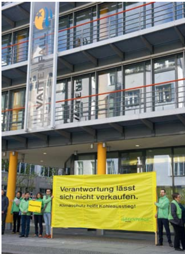
ODPOVĚDNOST SE NEDÁ PRODAT. Proti prodeji aktiv Vattenfallu protestovali v Berlíně zástupci německých Zelených. Švédská firma podle nich utíká před náhradou ekologických škod.

Podle údajů, které uvedl Vattenfall, si EPH nesmí tři roky vyplácet dividendy ani