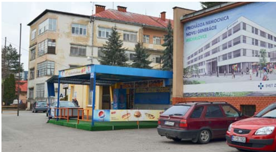
STARÁ A NOVÁ. Občané města Michalovce by se měli nové nemocnice dočkat za rok a půl. Ta stará má nejlepší časy dávno za sebou.

Snaha o zlepšení tohoto stavu tu byla už před dvaceti lety. V roce 1997 se začal stavět nový pavilon podle ambiciózního projektu, který sliboval jedenáct podlaží a heliport na střeše. Ten se ovšem později smrškl na pět a nakonec se zastavil úplně kvůli nedostatku peněz. Vrtulníky s nemocnými dnes odlétají a přistávají na ploše přímo před městským hřbitovem. Z rozestavěného pavilonu zbyl jen betonový skelet a promarněných 280 milionů tehdejších slovenských korun. Stavba se zbourala v minulém roce, kdy nemocnici převzala spo-