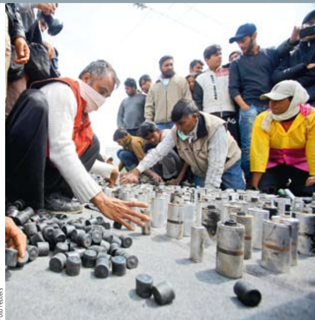
MAKEDONSKÝ ARZENÁL. Nechtění obyvatelé tábořiště v Idomeni ukazují, jakými prostředky proti nim v neděli vyrukovala makedonská policie.

Vztah Srbů k Evropské unii je podle předloňského průzkumu agentury Ipsos dost složitý. Pozitivně vidí integrační projekt s EU 32 procent dotázaných, v případě Ruska to je ale 52 pro-