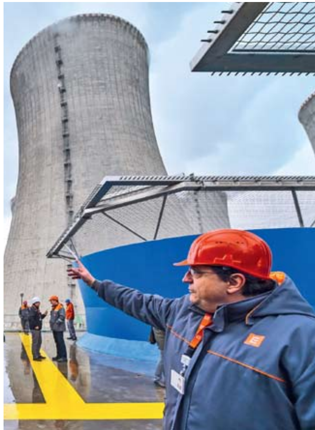
JADERNÉ TRABLE. Kvůli nucené čtyřměsíční odstávce tří bloků v Dukovanech (foto) a odstávkám Temelína přišel ČEZ loni o 2,7 miliardy korun. Na zisku výpadek vidět nebyl díky vratce darovací daně z emisních povolenek ve výši 3,8 miliardy korun.

V příštích letech hodlá česká energetická skupina růst jen v plně nebo částečně regulovaném byznysu, který slibuje zajištěný zdroj příjmu i v době, kdy se klasická výroba elektřiny potácí na pokraji přežití. ČEZ chce investovat do nákupu zahraničních obnovitelných zdrojů, tepláren v Česku a Polsku a výhledově také do distribučních společností. Na příštích pět let na to má