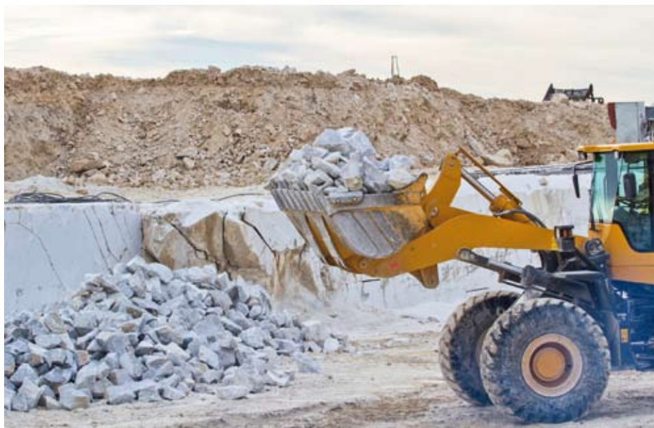
NÁVRAT DO METROPOLE. Mramor ze Slivence se chystá do boje s konkurencí na pražském stavebním trhu.