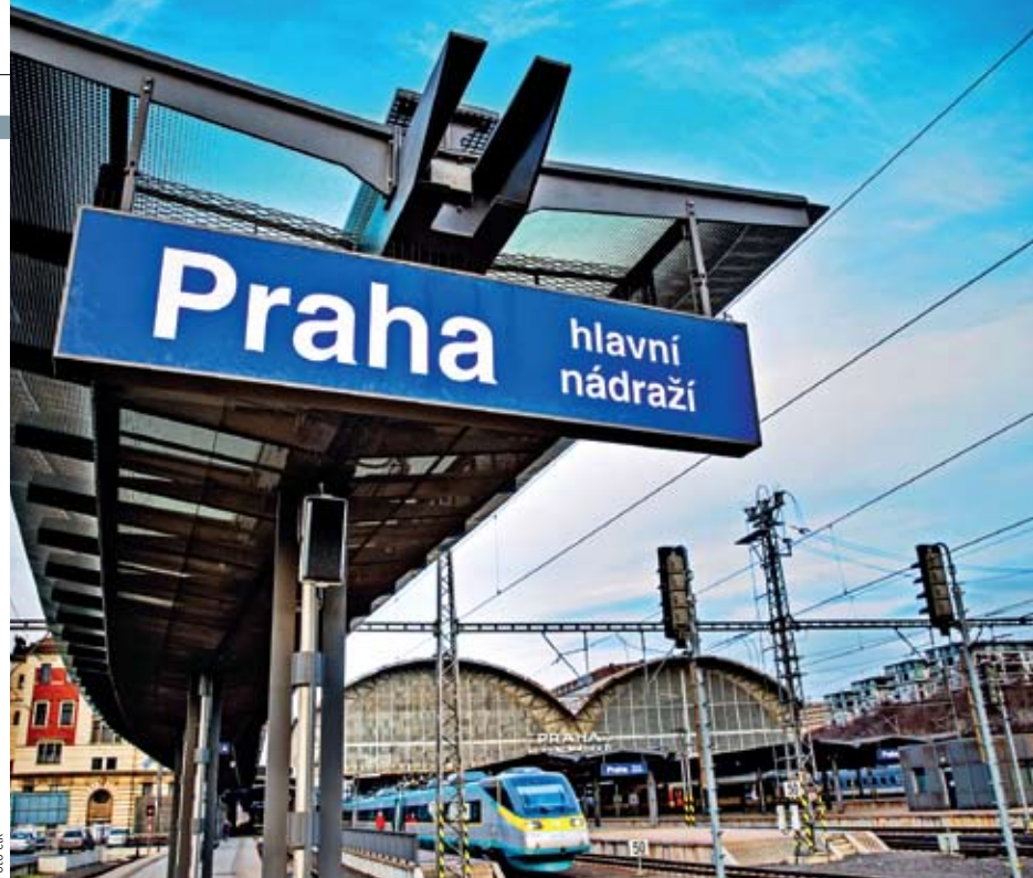
ZÁSADNÍ PROBLÉM. Nejspornějším bodem přesunu drážního majetku je pražské hlavní nádraží.

K zajištění postupného útlumu těžby už minulý týden vyzvala tripartita Moravskoslezského kraje. Ideální by podle zástupců firem a kraje byla dohoda mezi OKD a státem o řízeném útlumu. Odbory preferují zestátnění OKD a útlum v režii státu. „Výhodnější pro stát bude přijatelnou formou podpořit udržení co největšího počtu stávajících míst v OKD a tím i v dalších firmách než vyplácet sociální dávky nezaměstnaným horníkům,“ uvedl vládní zmocněnec Jiří Cienciala.