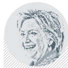
Hillary CLINTONOVÁ AMERICKÁ POLITIČKA

První nominaci Demokratické strany v boji o Bílý dům má doma. V lowe ale zvítězila historicky nejtěsněji.