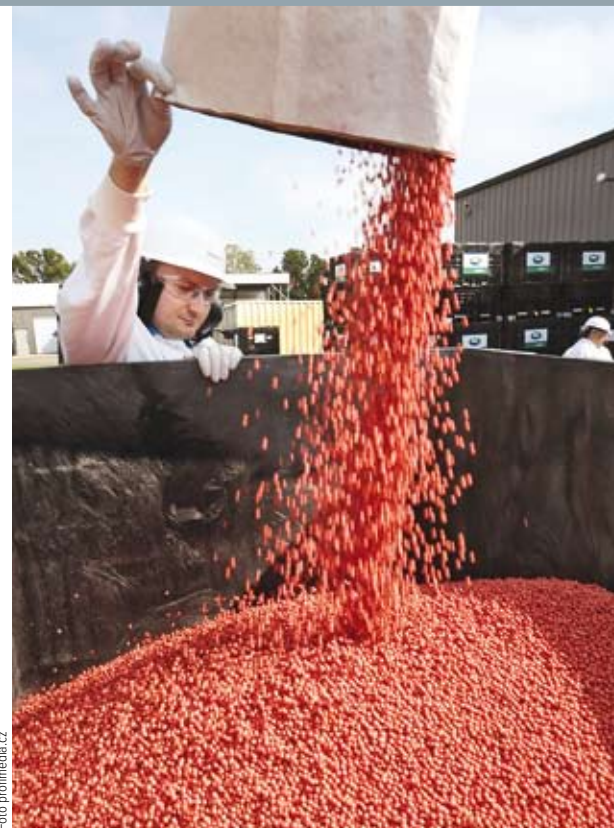
OŠETŘENÁ SÓJA. Syngenta patří k největším světovým hráčům v oboru péče o zemědělské plodiny.

Evropský výrobce v posledních třech letech vždy získal více objednávek na trhu menších tryskových letadel.